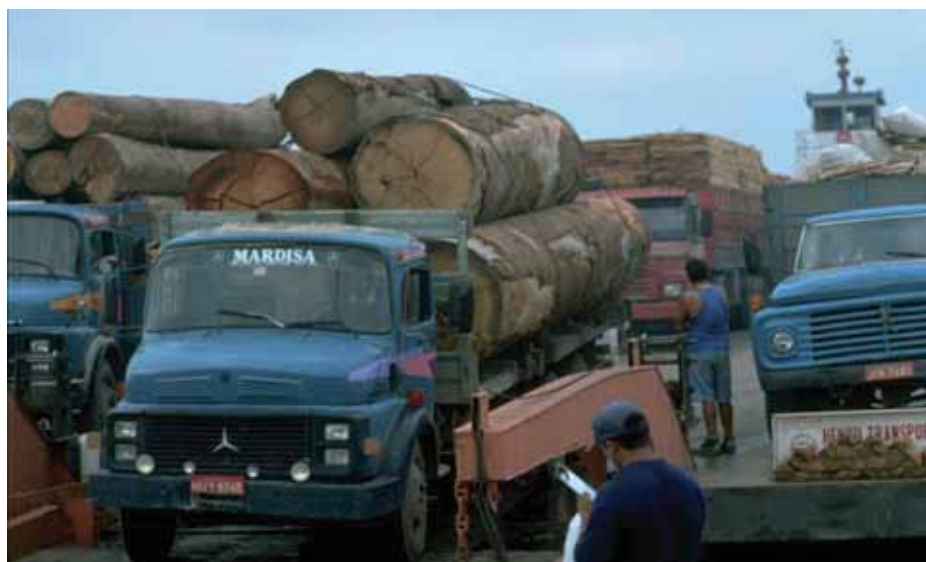
Грузовики, нагруженные брёвнами и частично обработанной древесиной, перевозятся на пароме в Бразилии.

транспортировки лесных товаров. Все чаще НОКЗР устанавливает импортные требования для ввоза такого оборудования. Контейнеры и другие единицы хранения также могут быть засорены вредными для леса организмами, почвой или отходами лесных товаров (то есть, ветвями, листьями и растительными остатками). Они должны быть очищены после использования, и засоряющие материалы уничтожены таким способом, который позволяет эффективно управлять фитосанитарным риском, например, сжиганием, глубоким захоронением, или вторичной переработкой в другие товары. Необходимо учитывать, что в некоторых странах местные правила управления окружающей средой или отходами могут влиять на принятие решений в отношении того, как материал может быть обработан или обезврежен. Необходимо заранее согласовать свои действия с соответствующим органом управления.