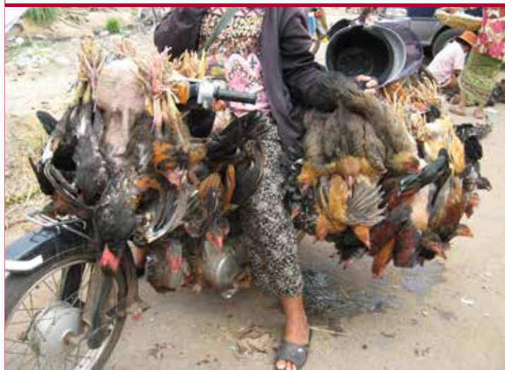
Transporte de aves altamente estresante

En muchos países en desarrollo, existe una demanda de carne fresca y los animales son a menudo sacrificados en los mercados en presencia del consumidor. En todo el mundo, miles de millones de personas compran sus aves de corral en los mercados tradicionales de productos frescos, muchos de los cuales carecen de licencia. Las aves son transportadas a menudo en condiciones de estrés. Los pequeños productores pueden utilizar los escasos