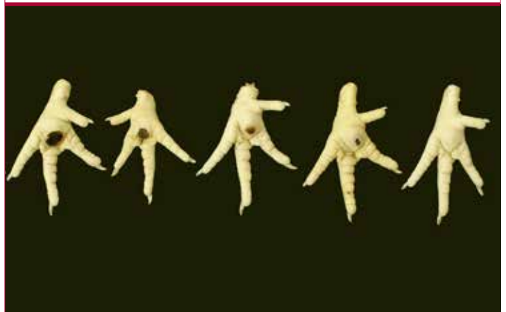
Pododermatitis de diversa gravedad en pollos de engorde

Entre los factores relacionados con el medio ambiente y el manejo que aumentan el riesgo de desarrollo de cojera en los pollos figuran la dieta, el régimen de iluminación y el uso de antibióticos (Knowles et al. , 2008). Asimismo, existe un acuerdo general sobre el hecho de que la densidad de población avícola tiene repercusiones sobre la cojera, si bien hay pruebas contradictorias al respecto. Dawkins, Donnelly y Jones (2004) documentaron que otros factores ambientales y de manejo, tales como la calidad del aire y la cama del alojamiento, podían tener más efectos negativos sobre el bienestar de las aves que la densidad de población. Sin embargo, una densidad de población elevada parece agravar otros problemas de bienestar. La Directiva 2007/43/CE del Consejo de Europa establece el límite de la densidad de población en las explotaciones donde se hayan detectado problemas de salud en las patas.