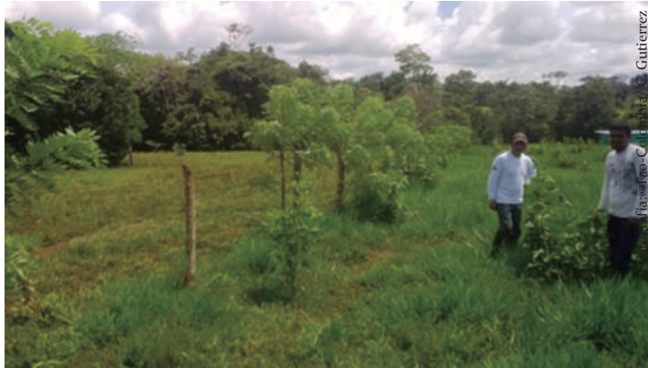
Imagen No 12. Cerca viva de matarratón en un sistema silvopastoril.