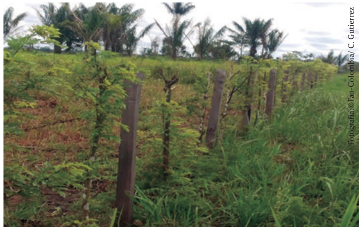
Imagen No. 7. Establecimiento de cerca viva en la vereda de Puerto Gaviotas, municipio de Calamar, Guaviare, en 2014.

El propósito primario de las cercas vivas es controlar el movimiento de los animales. Dentro de sus principales objetivos están mejorar las condiciones microclimáticas, delimitar áreas y servir como barreras. Las cercas vivas pueden proveer leña, forraje, alimento para el ganado, actuar como cortinas rompevientos y enriquecer el suelo, dependiendo de las especies que se utilicen.