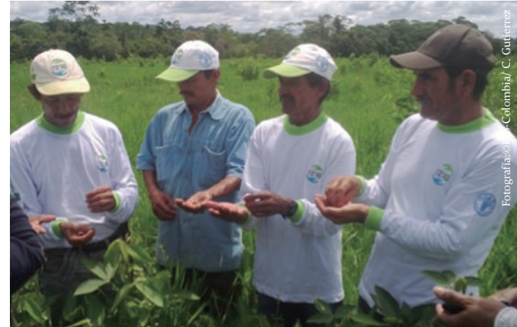
Imagen No. 13. Selección de semilla de Flemingia sp , en la vereda Diamante 2, Calamar, Guaviare.

ECA teniendo en cuenta criterios de calidad para selección de semilla, seguido a esta actividad se establecerán las semillas por varios métodos. Ej: embolsado, siembra directa, semillero. En la próxima sesión se analizarán y se sacarán conclusiones sobre las mejores prácticas para seleccionar y propagar material vegetal dentro de un sistema silvopastoril.