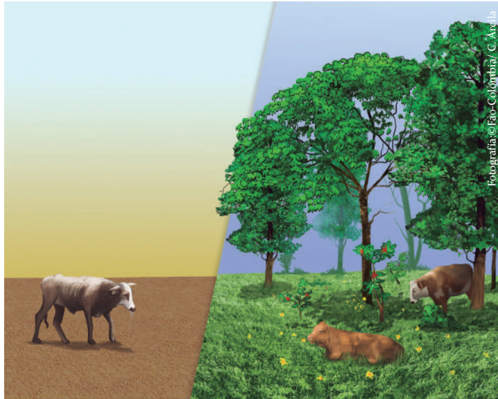
Ilustración No 2, Diferencias del confort animal bajo un modelo de ganadería convencional vs Sistemas silvopastoriles