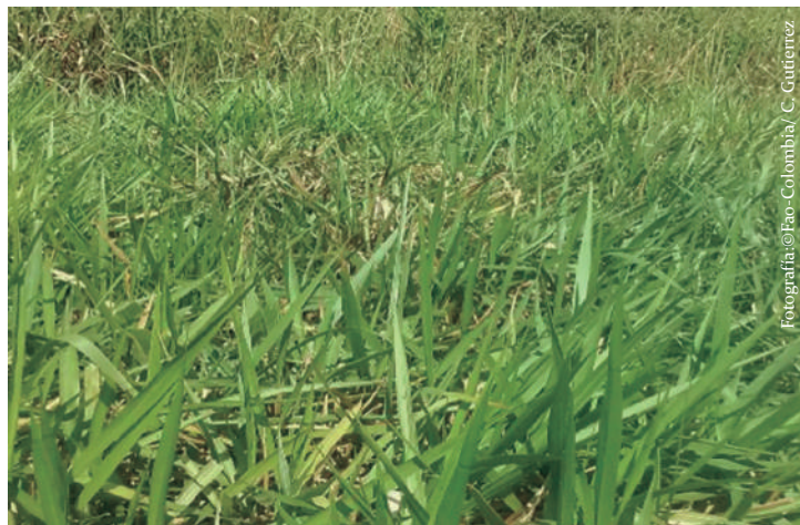
Imagen No 8. Pasto brizanta, Brachiaria brizantha marandú .

Manejo: Se utiliza en pastoreo directo y henificación, los primeros pastoreos deben ser suaves, hasta alcanzar una buena producción de forraje, el pastoreo rotacional es el más recomendado, pues este amplía los periodos de descanso.