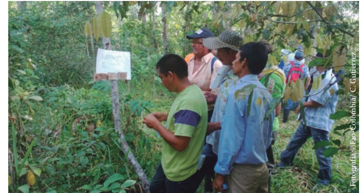
Imagen No. 1. Prueba de caja, sistemas silvopastoriles, estación experimental El Trueno (SINCHI).