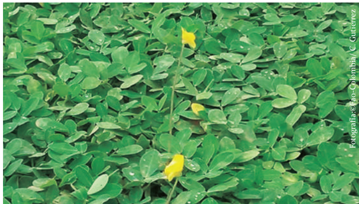
Imagen No 10. Maní forrajero, Arachis pintoi .

Son una familia diferente a las gramíneas, entre sus características principales están: sus semillas se encuentran dentro de vainas, las raíces poseen unos engrosamientos llamados nódulos que tienen como función fijar nitrógeno de la atmósfera e incorporarlo al suelo, pueden ser herbáceas, arbustos o árboles. Se destacan las siguientes: kudzu, maní forrajero, flemingia, cachimbo, matarratón, casco de vaca, cámullo, entre otros.