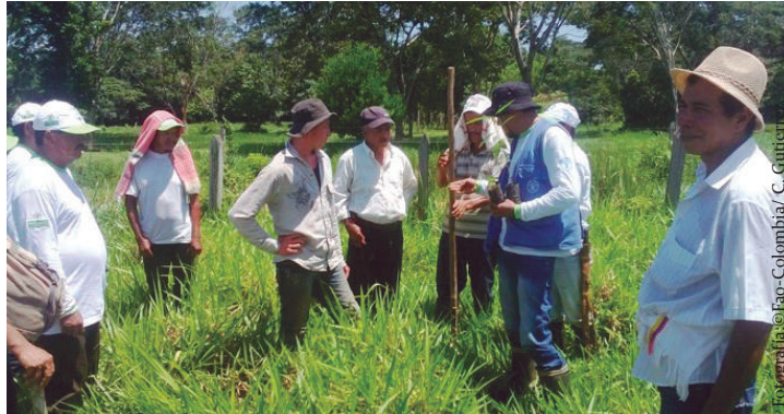
Imagen No. 5. Identificación de gramíneas y leguminosas en la vereda La Gaitana, en el municipio de Calamar, Guaviare.

El facilitador realizará las aclaraciones respecto a las inquietudes o dudas que tengan los participantes en torno a la temática abordada, teniendo en cuenta los siguientes criterios: