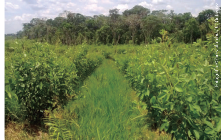
Imagen No 13. Surcos de flemingia en un sistema silvopastoril.

Esta especie se utiliza principalmente para cercas vivas, también para banco proteína. La densidad de siembra es de 1x1 metro cuadrado. Es una de las especies de mayor producción de biomasa (forraje) por unidad de área con 80 toneladas por hectárea al año con un porcentaje de proteína de 19.6% y se realizan entre cuatro y cinco cortes en el año. Además, es una especie recuperadora de suelos que han sido desgastados, mediante captación de nitrógeno de la atmósfera y su posterior incorporación al suelo.