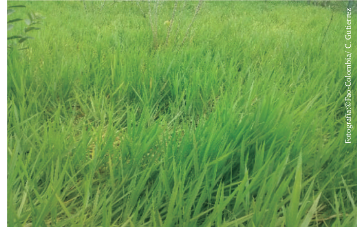
Imagen No 6. Pasto amargo o pasto decumbens, Brachiaria decumbens .