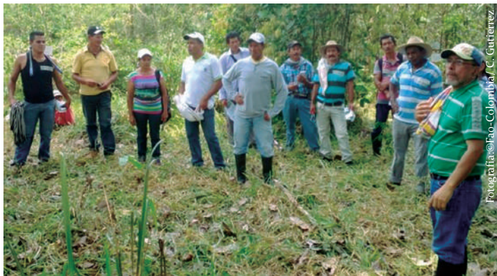
Imagen No. 3. Dinámica con productores en la estación experimental El Trueno - SINCHI.