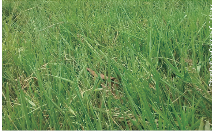
Imagen No 7. Pasto Humidicola o pasto aguja, Brachiaria humidicola.