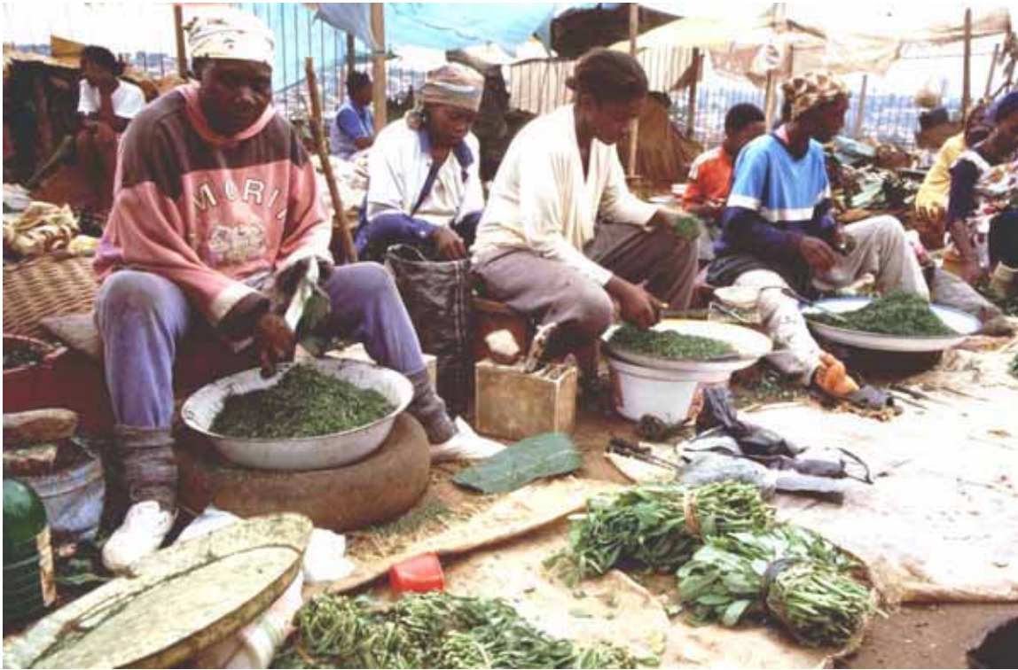
Femmes préparant les produits récoltés dans la forêt pour la vente