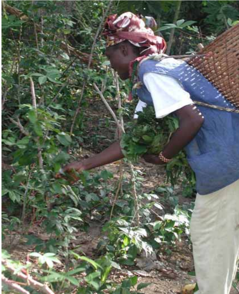
Femme collectant des PFNL dans la forêt