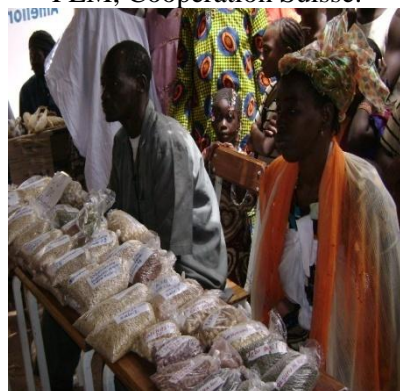
Producteurs participants foire de Sadien 2009