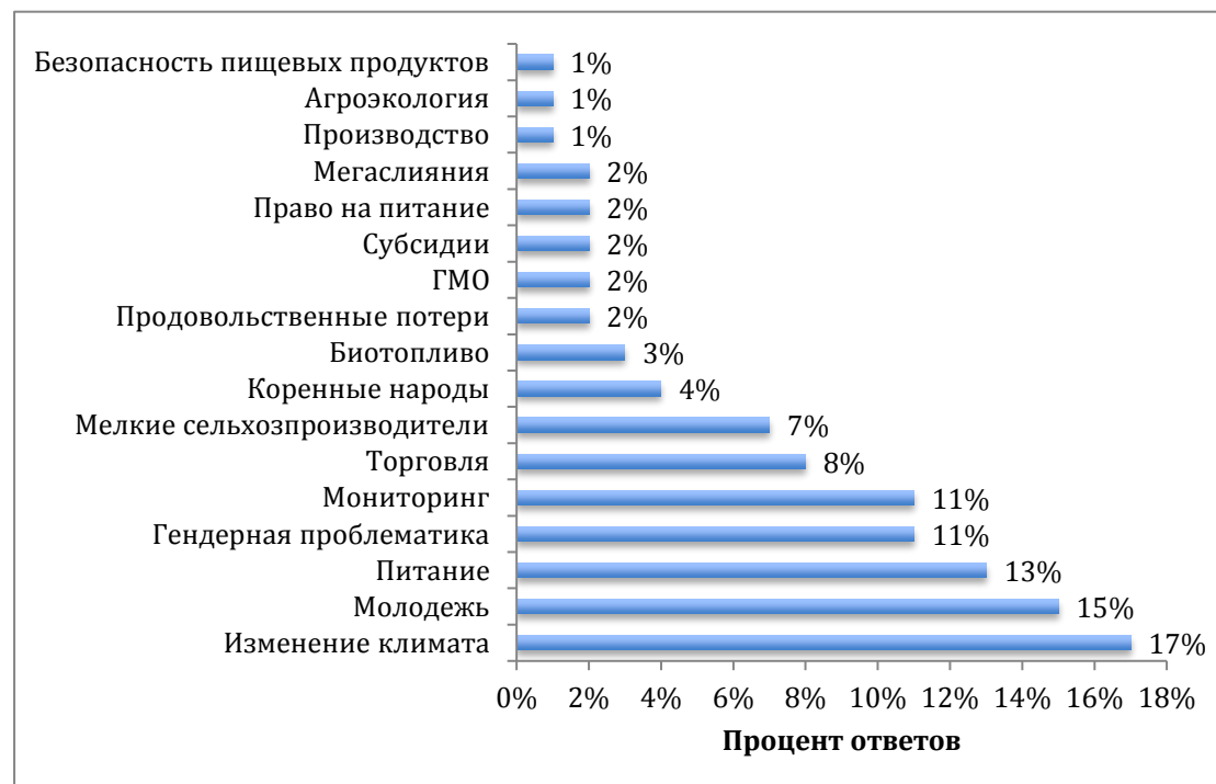
Диаграмма 1. Вопросы, требующие более пристального внимания

Количество ответов = 132, количество респондентов = 57