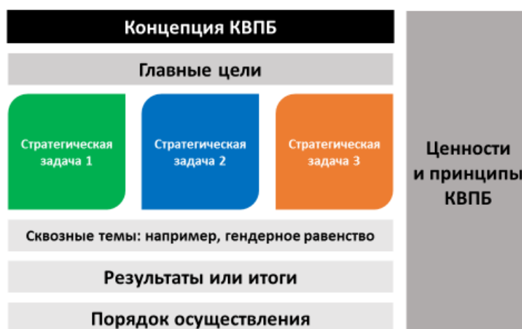
Схема 1: Основные элементы стратегического плана/стратегической рамочной программы

ES51. Разрабатывая стратегический план/стратегическую рамочную программу, Комитет должен опираться на подготовленные ГЭВУ аналитические документы по критически важным и вновь возникающим проблемам, которые скоро должны выйти в свет, и на информацию о текущей деятельности других глобальных субъектов, занимающихся вопросами ПБП. Это позволит КВПБ более точно определить свою нишу в этом процессе и понять, в каких его аспектах он сможет внести наиболее ценный вклад в общее дело. Стратегический план/стратегическую рамочную программу следует составлять с учетом местного контекста: у КВПБ должна быть информация о национальных приоритетах в области ПБП, а также сведения о существующих и планируемых национальных платформах. Хорошими источниками информации о национальных приоритетах и платформах являются Консультативная группа, расположенные в Риме учреждения и ВОЗ.