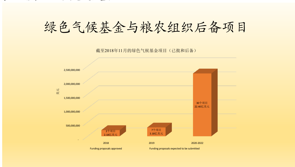
表 1：粮农组织与绿色气候基金