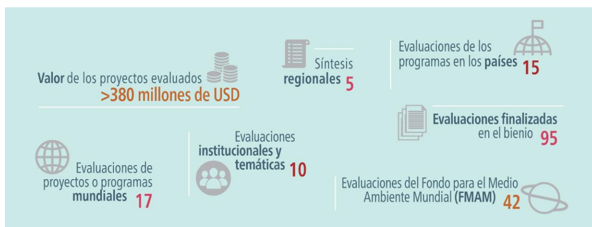
Figura 1: Resumen de los datos de las evaluaciones