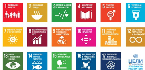
Ассигнования по линии ПТС в разбивке по ЦУР (проекты, завершённые в 2018–2021 годах)

программу четырёх направлений улучшений и задач, предусмотренных целями в области устойчивого развития.