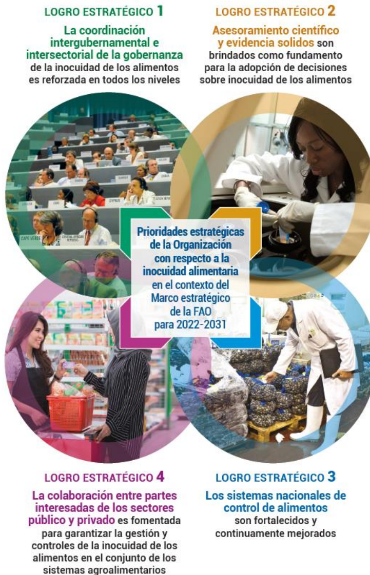
Figura 2: Los cuatro logros estratégicos que apoyan las Prioridades estratégicas de la FAO con respecto a la inocuidad alimentaria en el contexto del Marco estratégico de la FAO para 2022-2031.

20. En los logros se incluyen varios elementos novedosos: