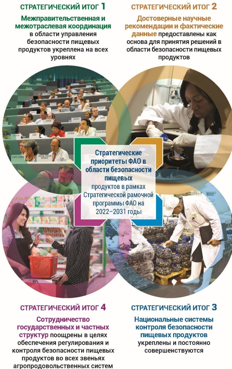
Рисунок 2. Четыре стратегических итога, соответствующие Стратегическим приоритетам ФАО в области безопасности пищевых продуктов в рамках Стратегической рамочной программы ФАО на 2022–2031 годы