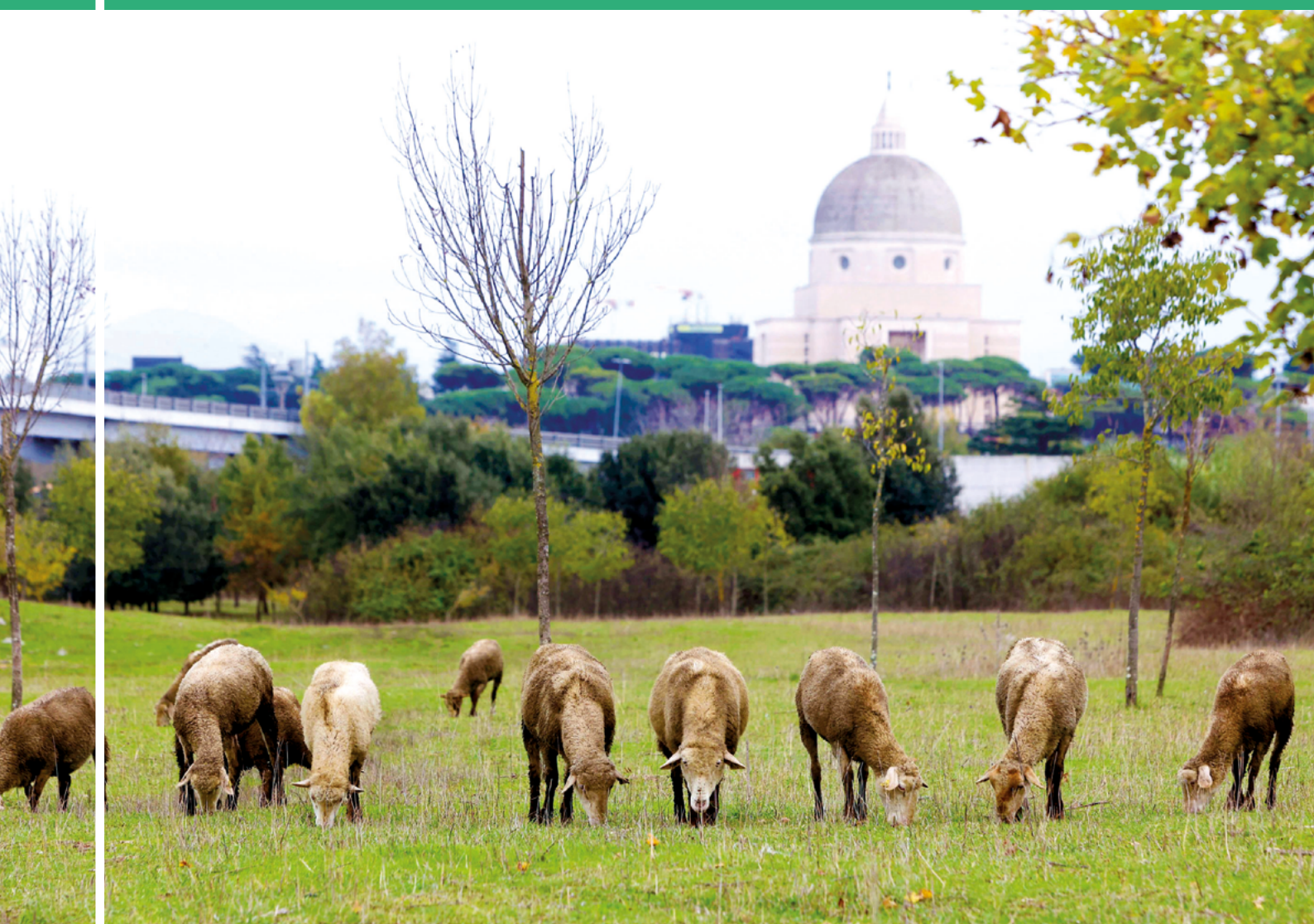
Roma (Italia): Ganado urbano. Un rebaño de ovejas pasta en los barrios periféricos del sur. 28 de noviembre de 2021.