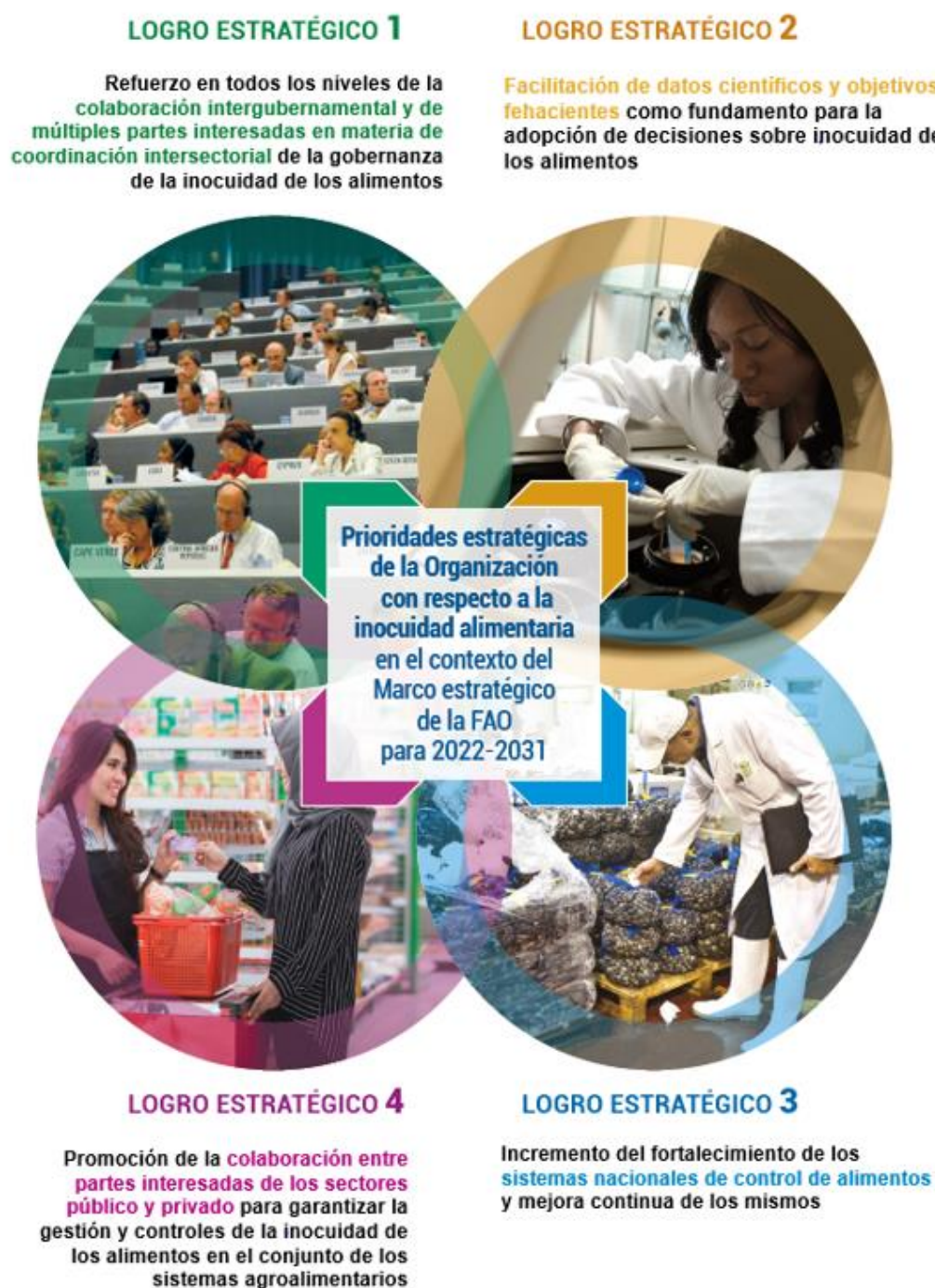
Figura 2: Los cuatro logros estratégicos que apoyan las Prioridades estratégicas de la FAO con respecto a la inocuidad alimentaria en el contexto del Marco estratégico de la FAO para 2022-2031 .