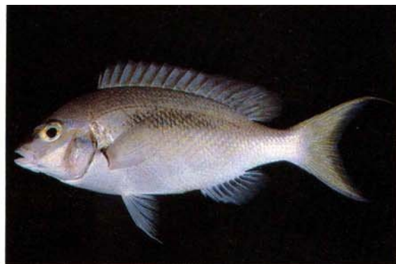
b) Scolopsis monogramma Ambon, Indonesia (J.E. Randall)