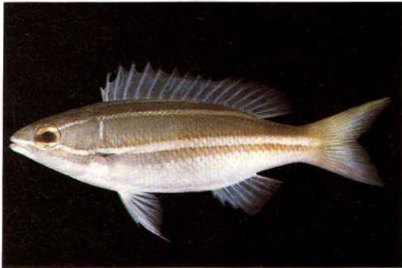
a) Pentapodus bifasciatus Singapore (J.E. Randall)