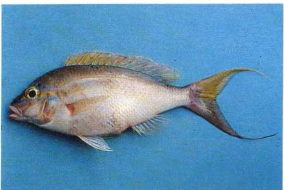
e) Scolopsis temporalis Flores, Indonesia (B.C. Russell)