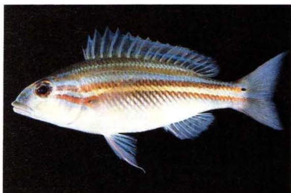
c) Scaevius milii Northern Territory, Australia (J.E. Randall)