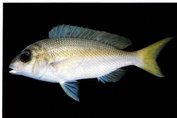
d) Scolopsis affinis Queensland, Australia (J.E. Randall)