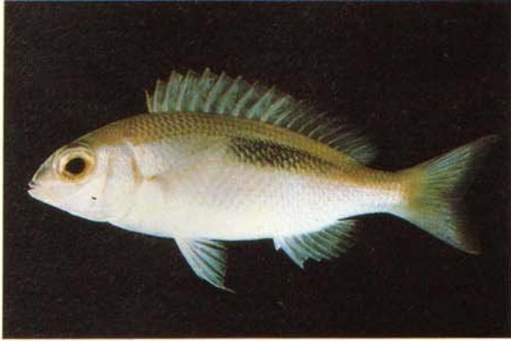
a) Scolopsis bimaculatus Vizhingham, India (J.E. Randall)