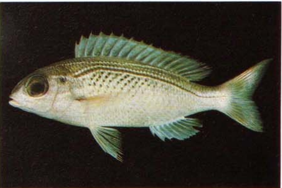
e) Scolopsis ghanam Red Sea (J.E. Randall)