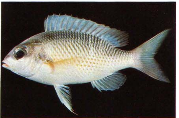
h) Scolopsis margaritifer Solomon Is. (J.E. Randall)