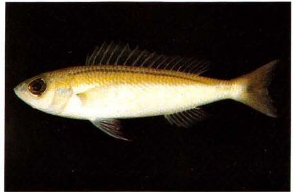
d) Pentapodus nagasakiensis Shirahama, Japan (J.E. Randall)