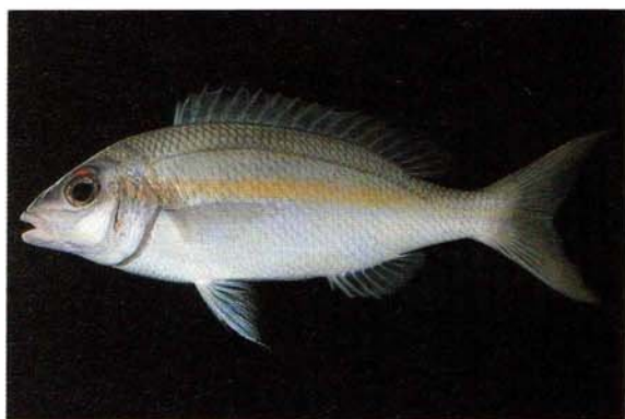
e) Scolopsis auratus Maldives (J.E. Randall)