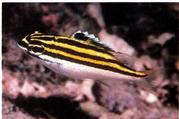
g) Scolopsis bilineatus , juvenile Queensland, Australia (G.R. Allen)