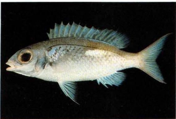
h) Scolopsis xenochrous Ambon, Indonesia (J.E. Randall)