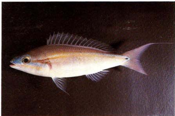
e) Pentapodus paradiseus Queensland, Australia (J.E. Randall)