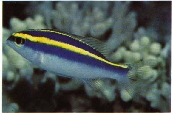
d) Scolopsis frenatus , juvenile Seychelles (R. Steene)