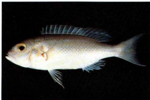
d) Scolopsis taeniopterus Cebu, Philippines (J.E. Randall)