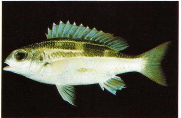
f) Scolopsis lineatus Guam (J.E. Randall)