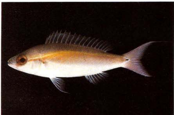
g) Pentapodus setosus Singapore (J.E. Randall)