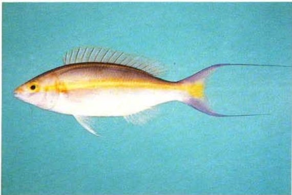
c) Pentapodus emeryii Lombok, Indonesia (J.E. Randall)