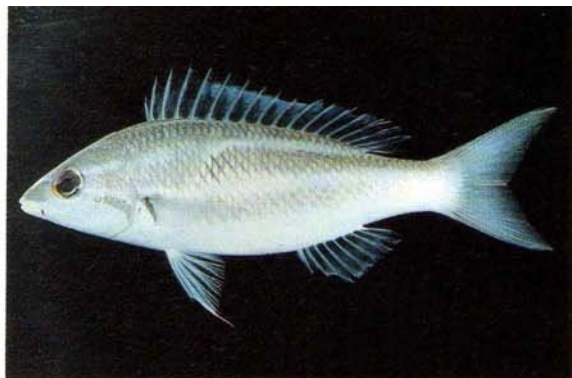
a) Pentapodus trivittatus Papua, New Guinea (J.E. Randall)