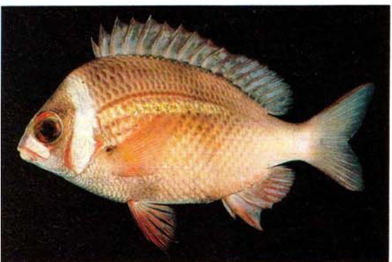
g) Scolopsis vosmeri Sri Lanka (J.E. Randall)