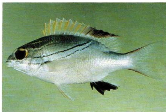
f) Scolopsis bilineatus Palau (J.E. Randall)