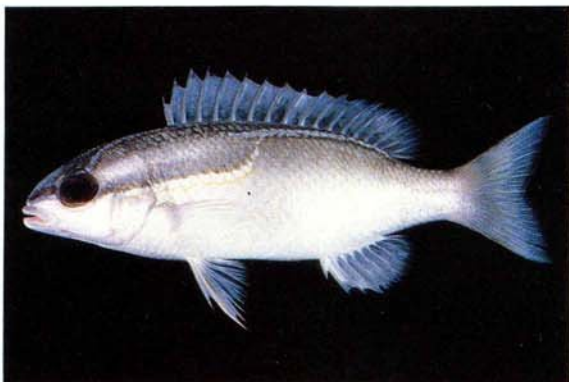
f) Scolopsis trilineatus Tonga (J.E. Randall)