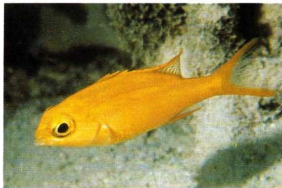
h) Scolopsis bilineatus , juvenile Fiji (G.R. Allen)