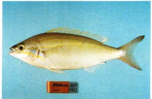
f) Pentapodus porosus Northwest Australia (CSIRO)