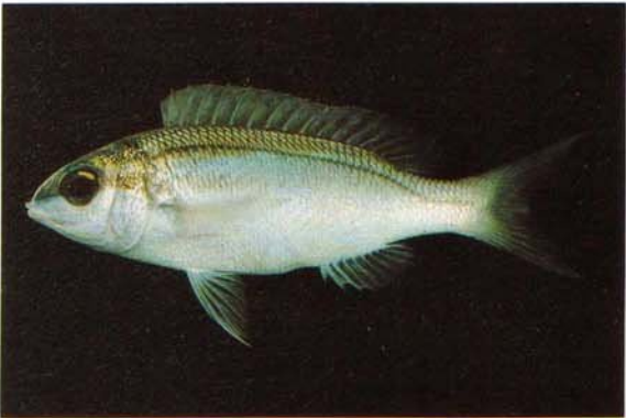
c) Scolopsis frenatus Seychelles (J.E. Randall)