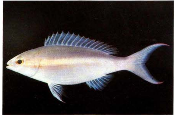
b) Pentapodus caninus Tulai, Pulau, Malaysia