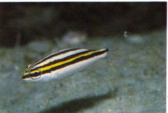
g) Scolopsis lineatus , juvenile Queensland, Australia (R. Steene)