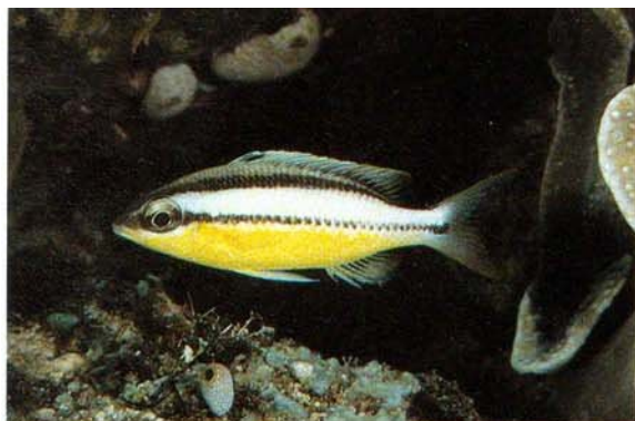
a) Scolopsis margaritifer , juvenile Flores, Indonesia (J.E. Randall)