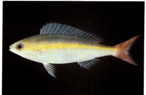
h) Pentapodus sp. New Caledonia (J.E. Randall)