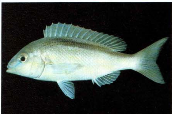
c) Scolopsis taeniatus Bahrain (J.E. Randall)