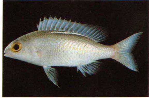
b) Scolopsis ciliatus Papua New Guinea (J.E. Randall)