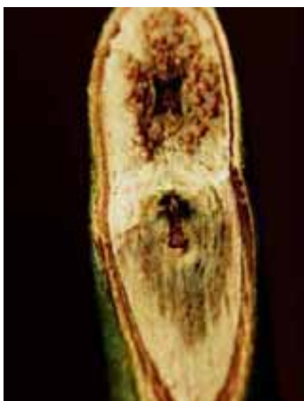
9.5 Manchado interno y exudado bacteriano (que se ve pardo). Ver 9.6 para síntomas de marchitamiento. Eucalyptus sp., México.