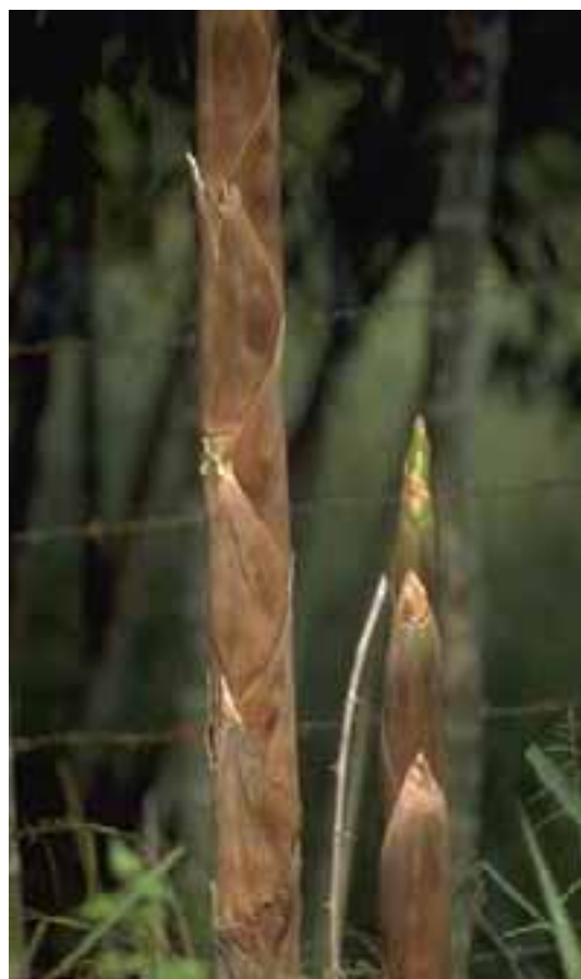
6.3 La muerte prematura de las vaina del culmo es el primer signo de que los tejidos bajos del culmo están muriendo. Guadua angustifolia , Quindío, Colombia.