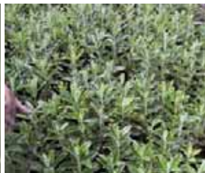
14.6 [arriba] Mildiú polvoriento que se muestra como capa blanca sobre las hojas. Buddleja sp., Cochabamba, Bolivia.