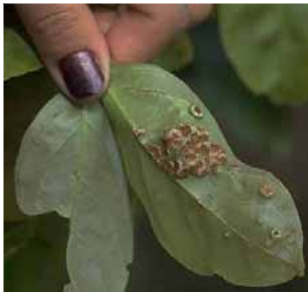
14.11 Roya ( Chaconia ingae ) con pústulas elevadas. Inga cylindrica , Santa Cruz, Bolivia.