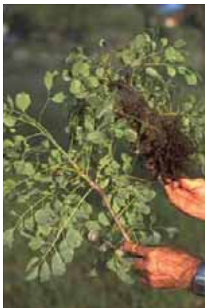
3.3 La enfermedad del retoño achaparrado reduce la producción de flores y frutos. Causa desconocida. Sclerocarya birrea , Gaborone, Botswana.