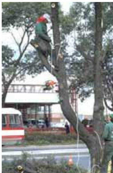
15.12 Poda para retirar ramas fuera de línea. Fraxinus udhei , Bogotá, Colombia.