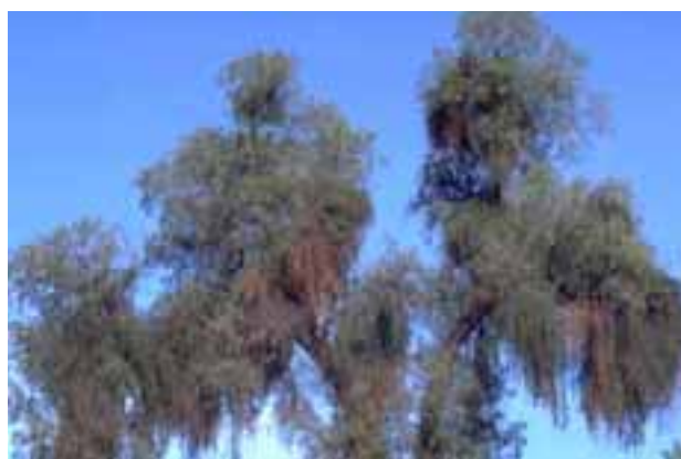
14.13 Planta parásita en la copa, como lo muestran las flores rojas de Ligaria cunefolia . Schinus molle , Santa Cruz, Bolivia.