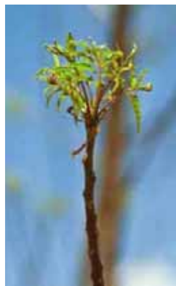
5.4 [der.] Entrenudos muy reducidos, tallos desnudos en la parte inferior y ramos de hojas pequeñas en el ápice, conocidos como "cuellos de jirafa", un síntoma de decaimiento del nim. Se cree asociado con sequía. Azadirachta indica , cerca de Sokoto, Nigeria.