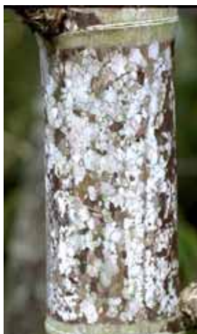
16.5 Líquenes creciendo en culmos. Guadua angustifolia , Quindío, Colombia.