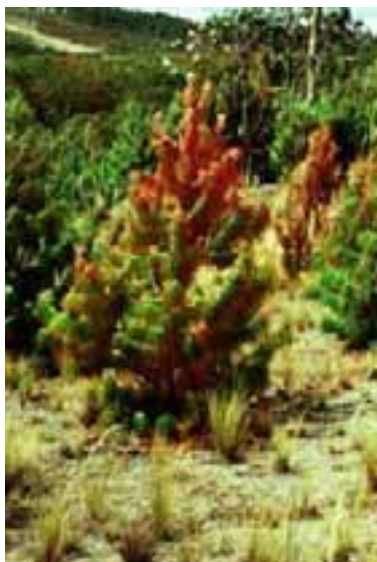
1.6 Daño por sequía. Árboles debilitados por mala plantación. Pinus patula , Venezuela.

No todos los cambios de color indican enfermedad o ataque de insectos [1.10]. Siempre compare el presunto problema con la condición o apariencia de los árboles en diferentes épocas del año. Los desequilibrios nutricionales en el suelo son frecuentemente culpados por cambios de color y otras respuestas de crecimiento alterado, pero existe poca información sobre esto para las especies arbóreas no comerciales.