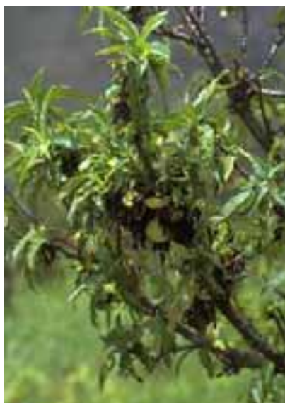
13.8 Alimentación por áfidos. El material negro es crecimiento fúngico "fumagina". Prunus persica , Pocona, Bolivia.

Marchitamiento de follaje en [13.11] y [13.13] que no es debido a infección sistémica por patógenos, sino a alimentación de animales en la corteza. Los árboles generalmente se recuperan en el año siguiente.