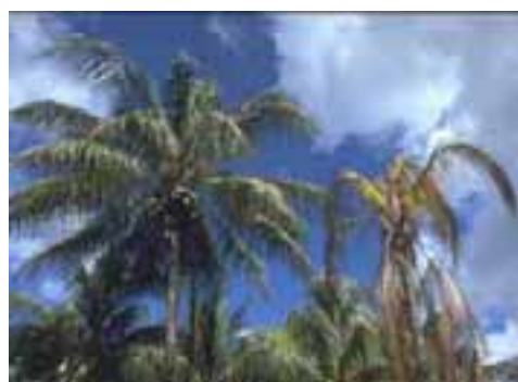
9.4 [der.] Enfermedad del amarillamiento letal de las palmas. Cocos nucifera , Florida, EE UU.