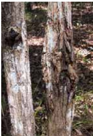
11.8 Cancros asociados con algunos diferentes hongos. Acacia sp., Kalimantan, Indonesia.