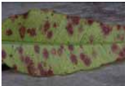
10.1. Lesiones posiblemente causadas por el hongo Kirramyces sp., Eucalyptus sp. Tailandia.

Las manchas y lesiones son comunes y no siempre es fácil diferenciar entre las provocadas por alimentación de insectos, hongos, bacterias, virus y los efectos de desórdenes nutricionales. Cuando se trate de lesiones en tallos, remueva cuidadosamente los tejidos para buscar si debajo hay necrosis [10.6].