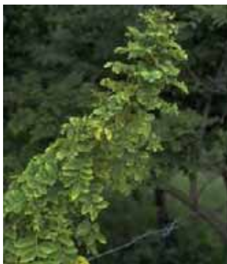
5.3 [izq.] Enfermedad de la hoja pequeña de Gliricidia (fitoplasma). La distancia de entrenudos se ve muy reducida provocando este tallo densamente foliado. Gliricidia sepium , Zamorano, Honduras.