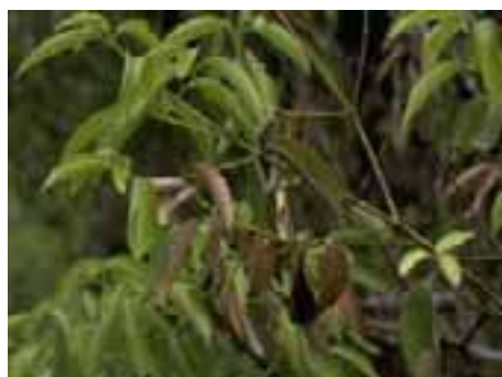
7.3 [arriba] Mal de hilachas causado por el hongo Koleroga noxia . Estos tizones son comunes en muchas plantas y son causados por diversos hongos. Theobroma cacao , Tingo Maria, Perú.