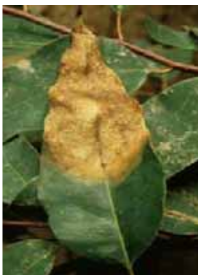
10.5 Algunas infecciones fúngicas afectan áreas grandes en lugar de causar manchas distintivas. Cylindrocladium sp. en Eucalyptus urophylla , Brasil.