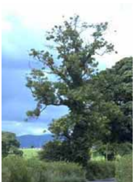
8.5 La muerte descendente es común en árboles de cercos, cuyas raíces pueden verse afectadas por prácticas agrícolas. No hay intervención primaria de plagas. Flaxinus excelsior , Reino Unido.