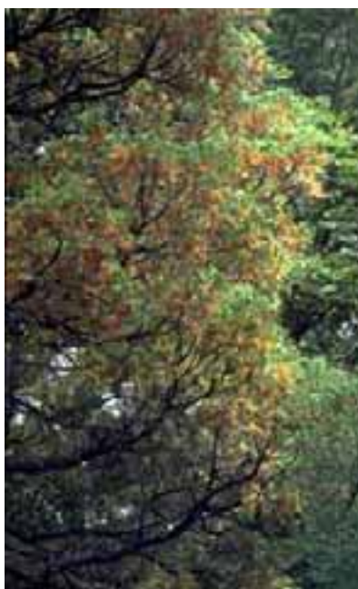
1.3 Enfermedad fungosa de la raíz es la causa sospechada de estos síntomas foliares y del decaimiento. Austrocedrus chilensis , Bariloche, Argentina.