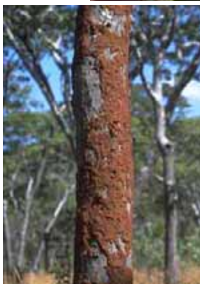
14.8 Alimentación superficial de termitas sobre la corteza, sin causar daño. Brachystegia sp., Malawi.