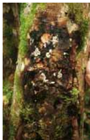
11.11 [der.] Cancro debido a Phellinus noxius . Hevea brasiliensis , Kalimantan, Indonesia.