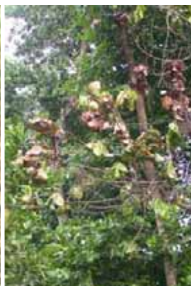
9.7 Marchitamiento de Takamaka causado por el hongo Leptographium calophylli . Calophyllum inophyllum , Praslin, Islas Seychelles.