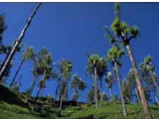
15.4 [arriba] Daño causado por poda de sombra en plantación de té. Grevillea robusta , Tamil Nadu, India.