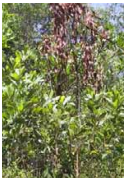
13.11 Daño por alimentación (ardillas) similar al mostrado en 13.13 . Acacia mangium , Kalimantan, Indonesia.