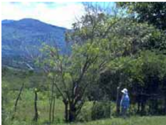
8.2 El mismo árbol de la 8.1 fotografiado exactamente un año después. Nótese la muerte descendente más extendida.