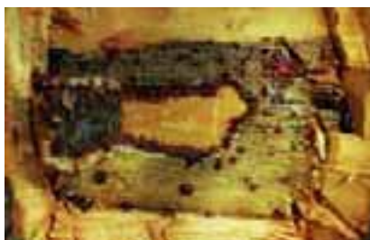
11.12 [arriba] Gomosis, síntoma asociado con factores abióticos. Eucalyptus sp., lugar desconocido