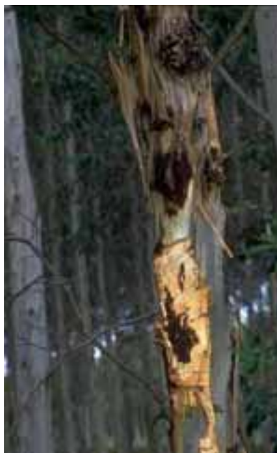
11.1 Cancro fungoso grave y mortal causado por Coniothyrium zuluense . Eucalyptus sp. KwaZulu, Sudáfrica. También mostrado abajo en 11.5 .

Los cancos pueden variar considerablemente de apariencia: algunos levantan bordes y producen cavidades, en tanto que otros parecen agallas o nudos. Los tejidos subyacentes deberían ser examinados para buscar si existe necrosis y evidencia de enfermedad.