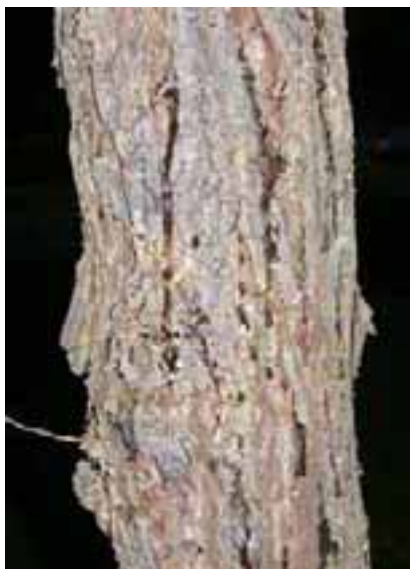
11.7 Sangrado de Seiridium cardinale , cancro fungoso. Cupressus lusitanica , Pretoria, Sudáfrica.

Algunos tipos de cancos no tienen grandes cavidades [11.7]. Nótese las características de gomosis en eucaliptos [11.12 y 11.13]