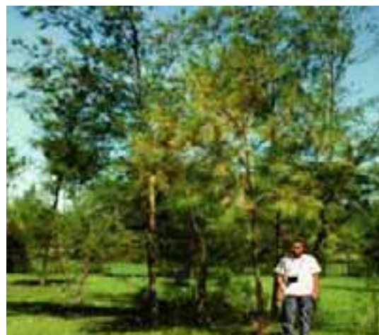
6.5 Pérdida de follaje (y amarillamiento) debido a marchitamiento bacteriano causado por Ralstonia solanacearum . Casuarina equisetifolia , China.