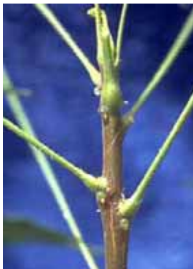
15.2 Inducido por sequía. El exudado es de nectarios extraflorales. Nótese el acortamiento de los entrenudos. Azadirachta indica , Nigeria.