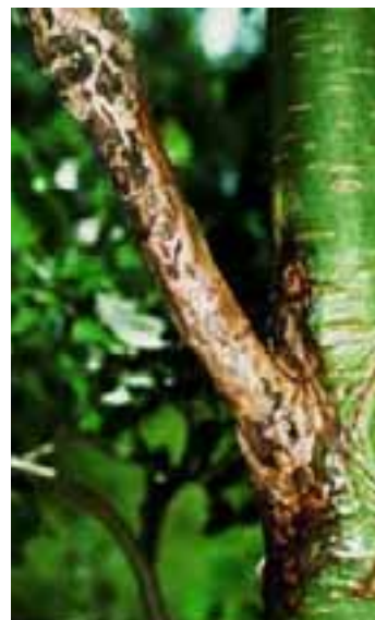
11.9 Cancro fungoso por Hypoxylon mammatum . Populus sp., EE UU.