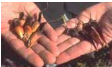
14.1 [arriba] La roya, Uleiella paradoxa mata a las semillas y forma masas negras. Araucaria araucana , Dead China, Chile.