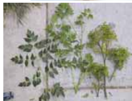
5.6 [der.] Follaje sano mostrado a la izquierda y, a la derecha, follaje enfermo por fitoplasma. Melia azedarach , Bolivia.