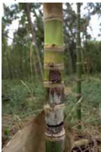
12.7 [der.] Crecimiento fungoso secundario sobre la superficie del culmo. Se sospecha que una enfermedad bacteriana ha causado la descomposición. Guadua angustifolia , Quindío, Colombia.