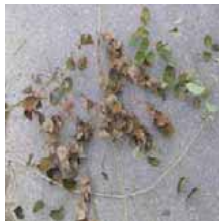
9.2 [arriba] Acercamiento del marchitamiento y hojas quemadas mostradas en la foto 9.1 .