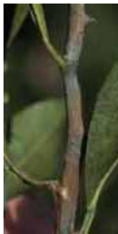
14.5 [der.] Moho aterciopelado debido a crecimiento del hongo Septobasidium S. Citrus , Santa Cruz, Bolivia.