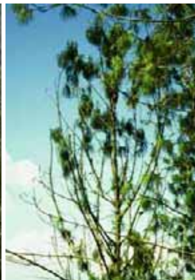
1.8 Deficiencia de boro, una condición reconocida en Pinus patula . Colombia.