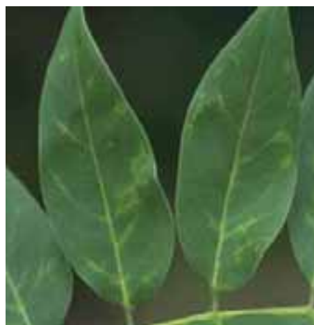
10.9 Decoloración y moteadura en follaje que se sospecha son producidas por virus. Gliricidia sepium . Honduras.