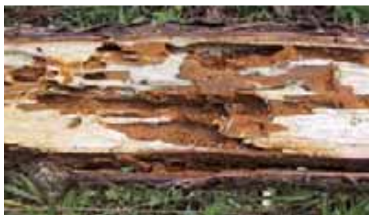
14.14 [arriba] Alimentación por termitas en raíz ( Coptotermes sp.) que puede causar daños severos. Gmelina arborea , Kalimantan, Indonesia.