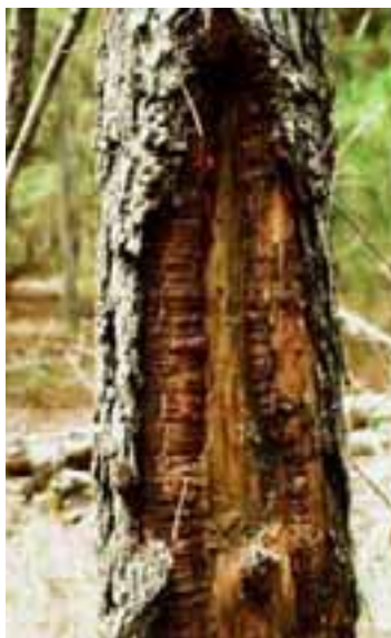
2.4 [centro] Hinchazón en el borde del cancro es parte del proceso de curación. Pinus sp., Brasil.