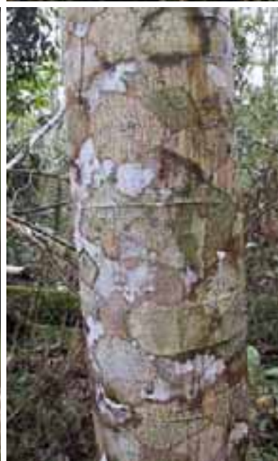
16.6 Diseño de muchos colores sobre el tronco debido a varias especies de líquenes. Paraserianthes falcataria , Indonesia.