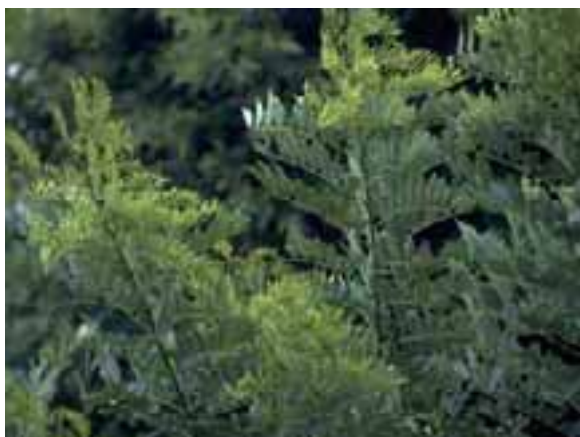
3.1 Las enfermedades virales producen hojas deformes (como cordones de zapatos) sobre los tallos más jóvenes. Gliricidia sepium , Vado Hondo, Guatemala.

Una variedad de plagas puede deformar las hojas y, a veces, los tallos jóvenes todavía carnosos. Los efectos pueden ser transitorios [3.2], como en ciertos casos de alimentación por insectos, pero otras formas de crecimiento alterado pueden estar acompañadas de pérdidas graves [3.3].