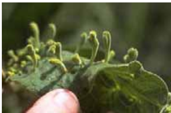
2.1 Agallas inducidas por ácaros causando daño significativo en viveros. Vangueria infausta , Gaborone, Botswana.

Las hinchazones en los tallos pueden ser leves [2.3] o pronunciadas. Las agallas son muy distintivas y a menudo sirven de diagnóstico para plagas específicas.