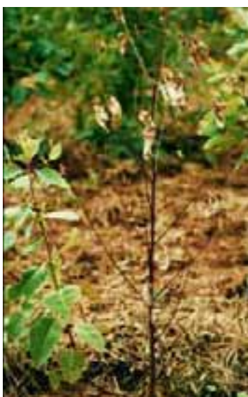
9.6 Marchitamiento bacteriano causado por Ralstonia solanacearum . Eucalyptus sp., México.