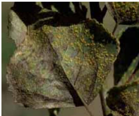
14.10 Roya ( Melampsora allii-populina ). Populus sp. Cochabamba, Bolivia.