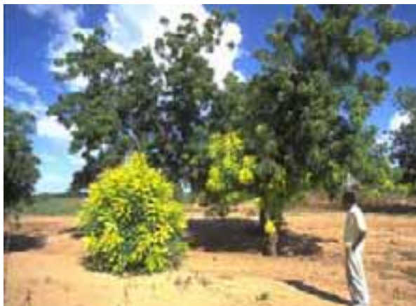
1.1 Causa desconocida, posible anomalía genética. No hay evidencia de ataque de plagas. Solamente un árbol afectado. Azadirachta indica , Níger

Los ejemplos en las Láminas 1A y 1B ilustran una amplia variedad de causas. Los desórdenes de nutrición y los "factores de sitio" son acusados frecuentemente de ser la causa de mala salud, como lo determina la apariencia de las copas. Pero deben buscarse también síntomas como hojas más pequeñas [1.2] y patrones poco usuales de decoloración de las hojas [1.5]