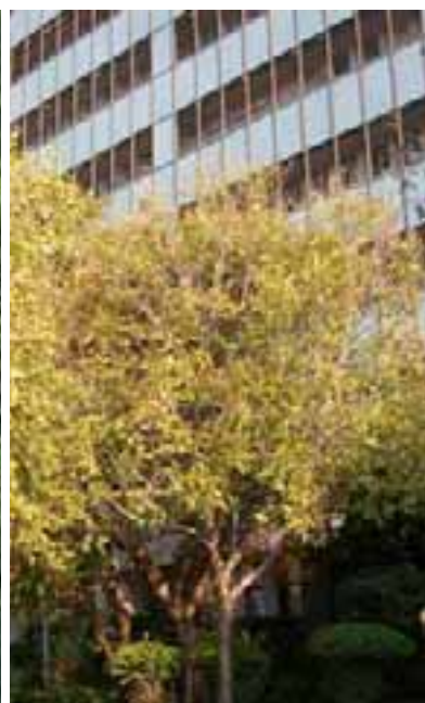
1.4 Anegamiento. Todos los árboles afectados y varios cercanos ya han muerto. Celtis africana , Pretoria, Sudáfrica.