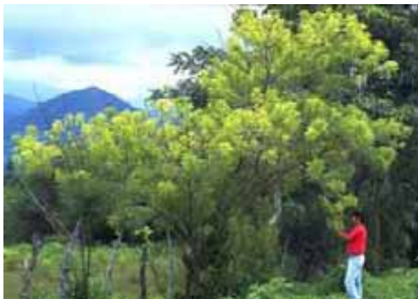
8.1 Nótese muerte descendente leve a la izquierda, debida a la enfermedad de la hoja pequeña (fitoplasma). El follaje amarillo también es anormal. Gliricidia sepium . Jutiapa, Guatemala.

Nótese que no todos los tallos sin hojas en la copa están necesariamente muertos. La muerte descendente está asociada con muchas causas diferentes, desde enfermedades en raíces y troncos hasta los efectos más amplios de pobres condiciones de crecimiento e inundaciones.