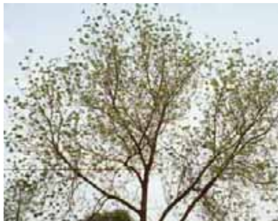
6.1 Las copas ralas y la caída prematura de las hojas, así como los síntomas de cuello de jirafa, indican decaimiento del nim. Azadirachta indica , Damaturu, Nigeria.

La caída prematura de hojas está ligada tanto a plagas [6.2] como a otras causas [6.1], aunque en el primer caso los árboles podrían usualmente exhibir otros síntomas, como descomposición de raíces. El efecto de influencias abióticas como sequía frecuentemente es temporal, con los árboles mostrándose saludables a medida que cae más lluvia. Los patógenos y las enfermedades ejercen impactos más profundos y de mayor duración en la salud de los árboles.