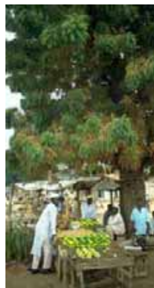
7.5 [der.] Insecto escama del nim, Aonidiella orientalis . Azadirachta indica , oriente de Nigeria en la frontera con Camerún.