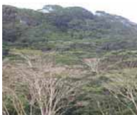
15.7 [izq.] Daño por helada. Pinus radiata , Rotorua, Nueva Zelanda.