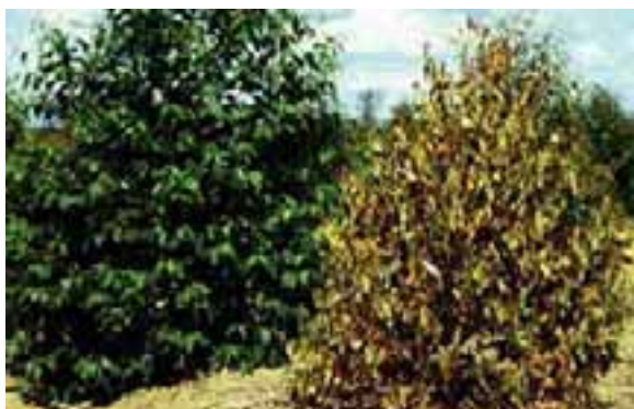
1.9 [arriba izq.] Enfermedad por amarillamiento (y muerte descendente) debido a una enfermedad por fitoplasma. Melia azedarach , Santa Cruz de la Sierra, Bolivia.