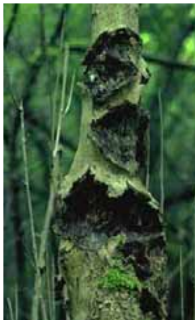
11.2 Compárense estos cancos fungosos causados por Nectria galligena con los cancos bacterianos mostrados en 11.3 . Fraxinus excelsior , Surrey, Reino Unido.