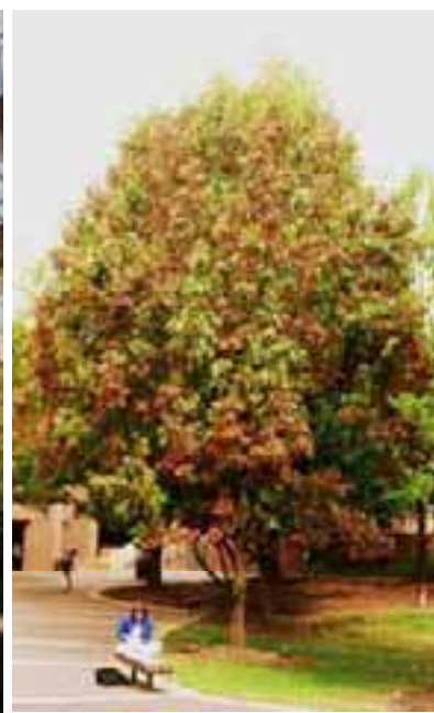
1.5 La quemadura foliar bacteriana causada por Xylella fastidiosa , es una enfermedad sistémica. Quercus velutina , Raleigh, Carolina del Norte, EE.UU.