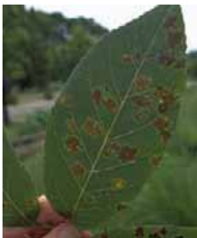
10.7 Roñas foliares fúngicas causadas por Apiosphaeria guaranitica . Tabebuia serratifolia , Vicosa, Brasil.