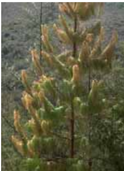
1.7 Probablemente daños por sequía. Pinus sp., Chuquisaca, Bolivia.