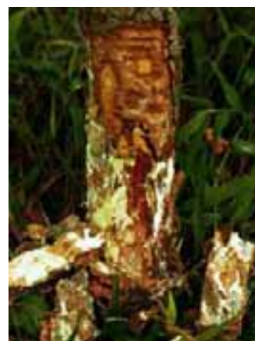
12.8 Fieitros fungosos de Armillaria mellea , causa muy extendida de pudrición de la raíz y muerte de árboles en áreas templadas y subtropicales. Metrosideros polymorpha , Hawai.