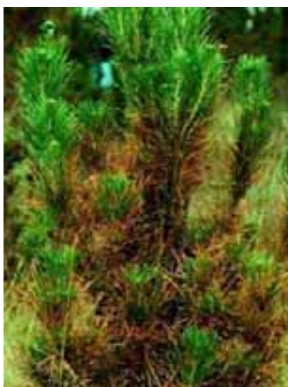
10.4 Tizón causado por Dothistroma . Se presentan bandas y cambios de color en las acículas en lugar de manchas distintivas. Pinus radiata , Ecuador.