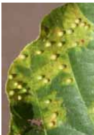
10.8 Agallas por insectos y amarillamiento. Ficus sycomorus Mangochi, Malawi.