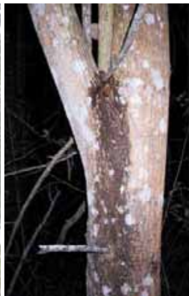
15.14 Flujo que sale de la unión de troncos principales. Causa desconocida. Los árboles "sangran" por razones fisiológicas y patológicas. Acacia auriculiformis , Kalimantan, Indonesia.