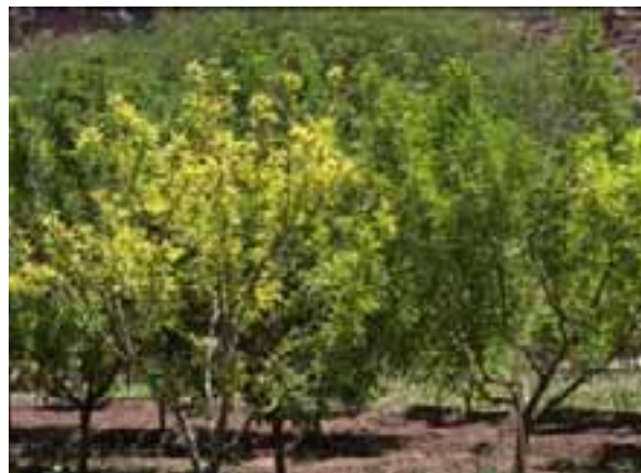
1.2 Amarillamientos sospechosos en melocotoneros (izquierda), enfermedad por fitoplasma. Las hojas son más pequeñas que las de árboles sanos. Prunus persica , Camargo, Bolivia.