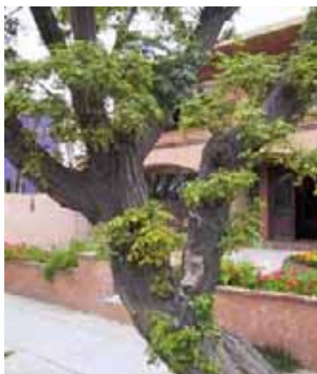
5.5 [izq.] Clorosis en Melia . Estimulación de brotes en el tronco principal. Hojas mucho más pequeñas y entrenudos reducidos; de ahí, los ramos compactos. Estas hojas mueren pronto y se caen. Melia azedarach , Cochabamba, Bolivia.