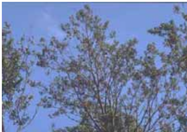
6.2 Pérdida de hojas debida a enfermedad de la raíz ocasionada por Phytophthora . Alnus glutinosa , Sussex, Reino Unido.