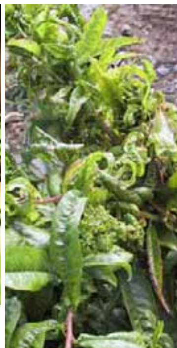
3.5 [arriba, der.] Síntomas de daño por áfidos, que algunos agricultores consideran relacionados con los mostrados a la izquierda en hojas enrolladas de melocotonero, y al que dan el mismo nombre. Prunus persica , Sucre, Bolivia