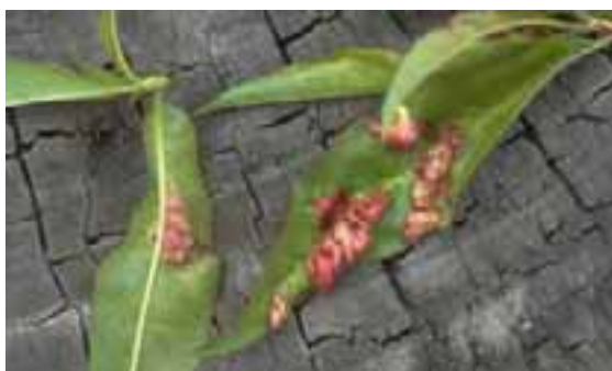
3.6 [izq.] Enrollamiento de la hoja del melocotonero, enfermedad fungosa muy distintiva causada por Taphrina deformans . Prunus persica , Epizana, Bolivia.