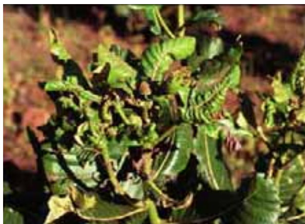
3.2 Enrollamiento de hojas y muerte de tallos, de origen desconocido. Posiblemente debido a alimentación de insectos o enfermedad viral. Uapaca kirkiana , Zomba, Malawi.