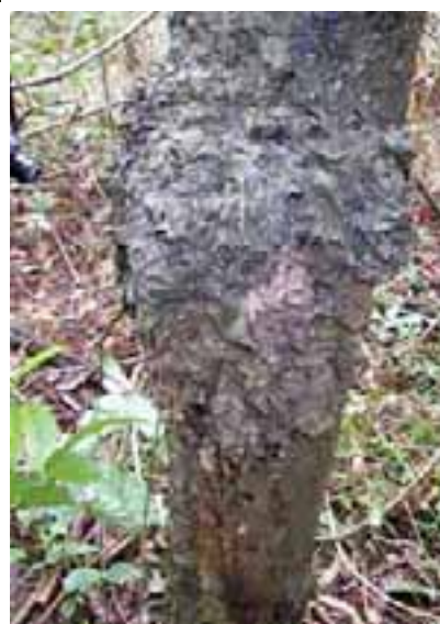
14.9 Nido de termitas (vacío). Paraserianthes falcataria , Kalimantan, Indonesia.