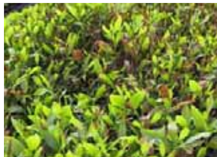
7.6 [arriba] Tizón foliar (quemadura) causado por deriva de herbicida en vivero. Acacia mangium , Kalimantan, Indonesia.