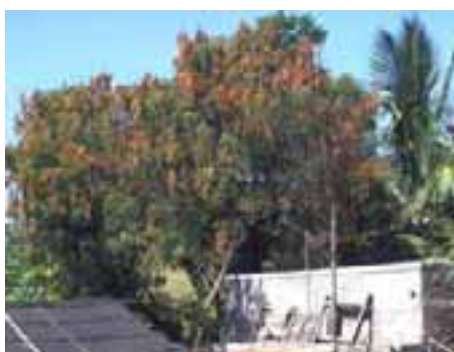
9.3 [izq.] La alimentación del mosquito del té, Helopeltis antonii , induce síntomas parecidos a marchitamiento. Azadirachta indica , India.