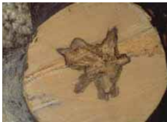
12.2 Infección que se sospecha es por Ganoderma sp. Acer pseudoplatanus , Francia.