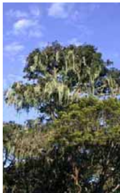
16.3 [der.] Festón de líquenes en las copas de varios árboles en el bosque de miombo. Mzuzu, Malawi