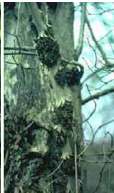
11.3 Cancros bacterianos causados por Pseudomonas savastanoi a los cuales a veces se les llama "nudos". Fraxinus excelsior , Yorkshire, Reino Unido.