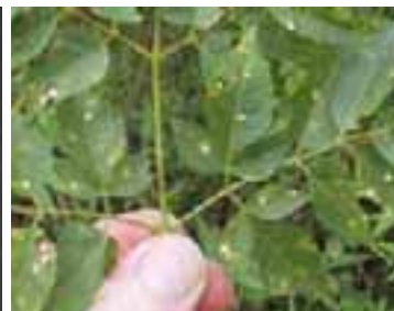
10.3 Manchas foliares fúngicas causadas por Cercospora meliae . Melia azedarach , Dinajpur, Bangladesh.