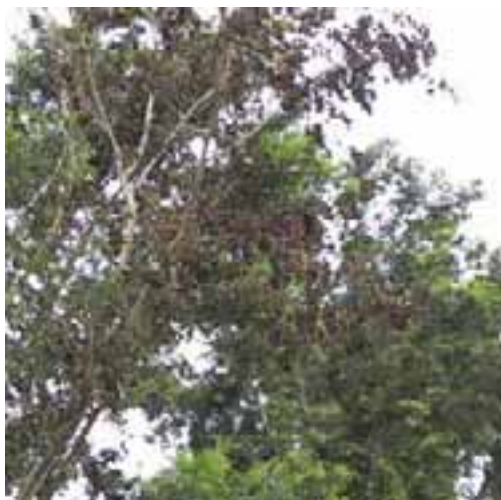
9.1 [izq.] Síntomas de marchitamiento que se creen asociados con la enfermedad causada por Fusarium en la raíz. Dalbergia sissoo , cerca de Bogra, Bangladesh.

A menudo el marchitamiento del follaje es menos distintivo en hospedantes leñosos, en comparación con el marchitamiento de hojas carnosas de cultivos anuales. Los marchitamientos son el resultado de las obstrucciones internas y con frecuencia van acompañados por manchado interno de tallos [9.5]. Nótese que no es fácil conseguir fotos claras de los síntomas de marchitamiento en las copas; las ramas afectadas deberían de removerse para fotografiarlas en forma separada.