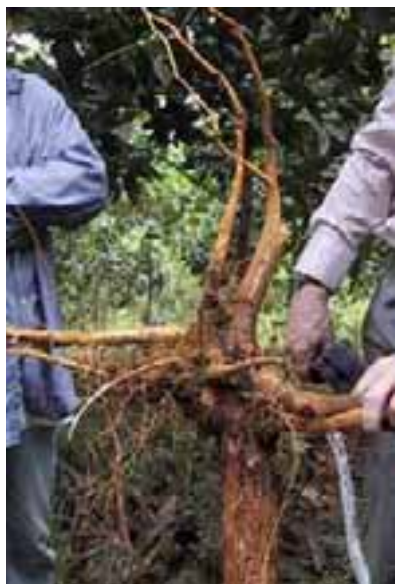
15.9 Las malas prácticas en viveros conducen a que las raíces se retuerzan. Los árboles crecen poco. Acacia mangium , Kalimantan, Indonesia.

La poda mal hecha es una fuente común de problemas futuros ya que las superficies cortadas permiten la entrada de potenciales patógenos. Los materiales de plantación de mala calidad debilitan el crecimiento futuro y hacen que los árboles se vuelvan más susceptibles al ataque de insectos.