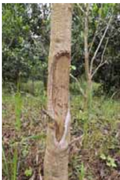
13.12 Daños por alimentación de ciervos. Gmelina arborea , Indonesia.