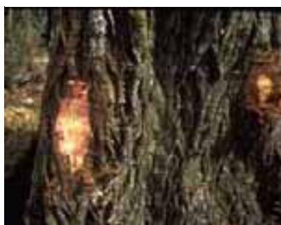
12.6 [arriba] A la izquierda, tejido sano; a la derecha, descomposición asociada con decaimiento. Austrocedrus chilensis . Bariloche, Argentina.