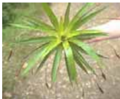
16.1 [arriba] Una de las varias bromeliáceas comunes encontrada en cacao. Theobroma cacao . Ecuador.