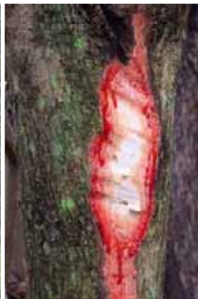
15.11 Sangrado normal de resina. Los guías cortan los árboles para los turistas y esto causa cicatrices. Pterocarpus indicus , Mahé, Seychelles.