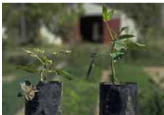
5.1 Compárese el crecimiento reducido a la izquierda con la plántula a la derecha. La mala nutrición o falta de agua son las causas posibles. No hay indicios evidentes de enfermedad viral. Erythrina falcata , Cochabamba, Bolivia.

El crecimiento reducido puede indicar condiciones pobres para el desarrollo [5.1]. Pérdidas mayores pueden ocurrir aun cuando no haya plagas involucradas [5.4].