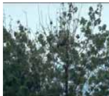
8.4 [der.] Muerte descendente aparente. Las aves han despojado el follaje para anidar, pero los tallos pueden aún estar vivos. Azadirachta indica , Garoua, Camerún.