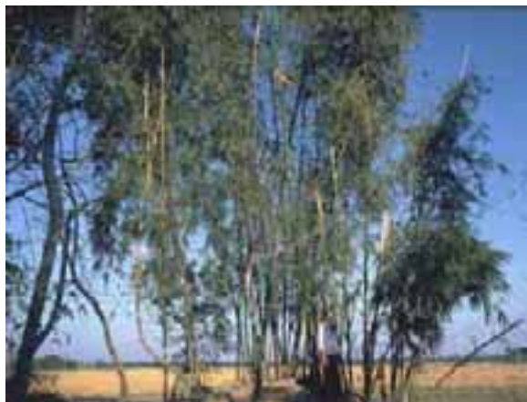
7.1 Tizón del bambú, sospechoso de ser una enfermedad fungosa. Nótese las porciones pardas y muertas de los tallos con tizón. Bambusa vulgaris , Chittagong, Bangladesh.

Tizón es un término general usado para describir la muerte de follaje o tallos, a menudo en ausencia de cualquier síntoma distintivo.