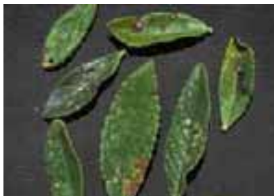
10.2 Manchas foliares comunes asociadas con el hongo Septoria sp. Polylepis incanae , Bolivia.