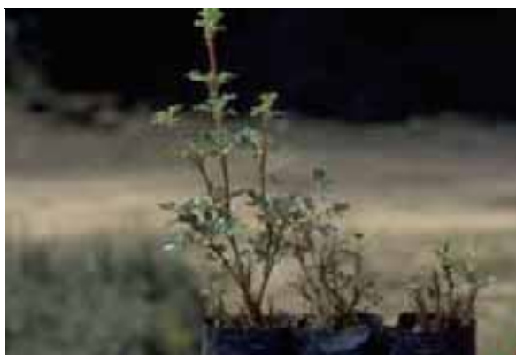
5.2 Esta especie nativa crece hasta los 4000 msnm o más, pero en este caso está desarrollándose muy mal a 2500 msnm. No se conoce la causa del "problema", pero podría deberse simplemente a desnutrición. Polylepis incana , Cochabamba, Bolivia.