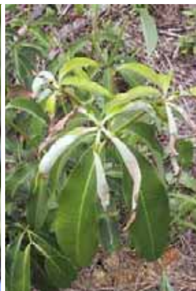
13.10 Pegador de hoja. Nombre de insecto desconocido. Dillenia sp. , Kalimantan, Indonesia.