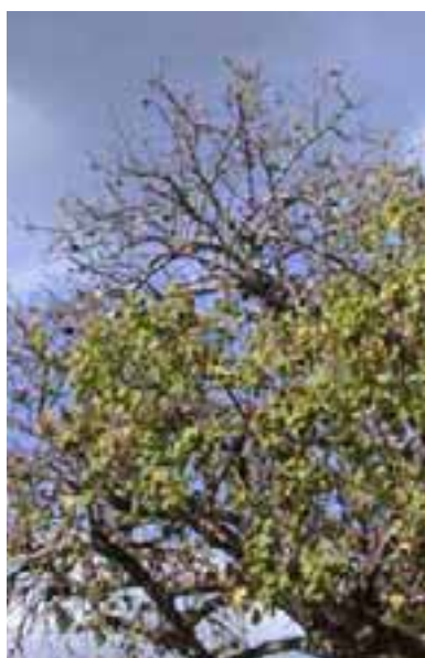
8.6 Muerte descendente posiblemente debida a interferencia mecánica con el sistema de raíces. Sterculia quinqueloba , pueblo de Mangochi, Malawi.