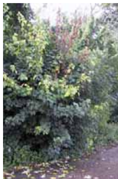
13.13 La remoción de la corteza por ardillas conduce a marchitamiento y clorosis. Acer pseudoplatanus , Surrey, Reino Unido.