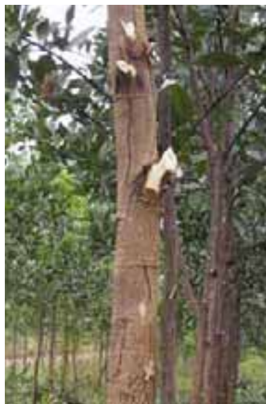
15.10 La poda mal hecha permite que los hongos penetren y se establezca la podredumbre del corazón. Acacia mangium , Kalimantan, Indonesia.