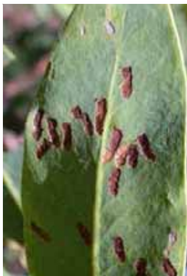
13.9 Insectos no identificados alimentándose. Hospedante desconocido, Mahé, Seychelles.