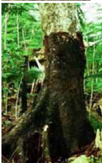
14.7 Feltro oscuro de micelio de Phellinus noxius . Delonix regia , Isla Saipán, Marianas.