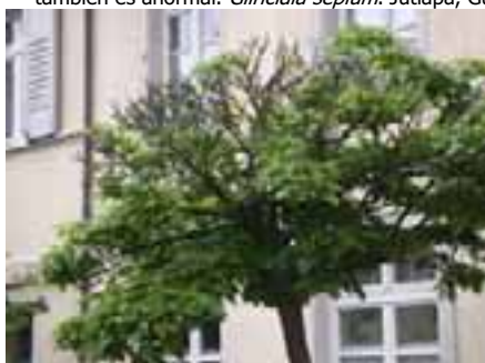
8.3 [izq.] Muerte descendente por causa desconocida en árbol de la calle. Catalpa bignonioides , Baden-Baden, Alemania.