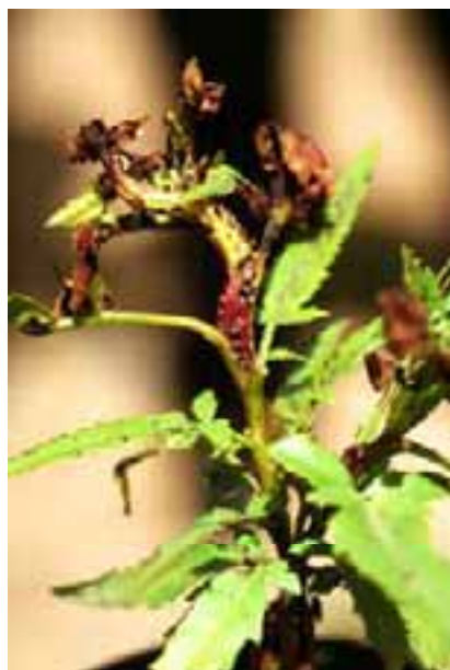
3.4 Ataque de psílido ( Calophya rubra ) produce hoyos en tallos y hojas y los debilita. Schinus molle , Cochabamba, Bolivia.