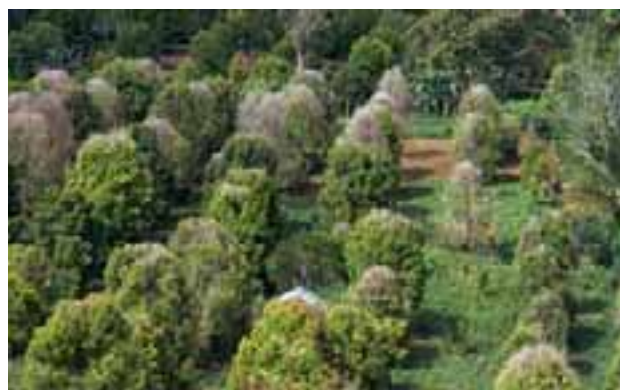
6.4 Pérdida de hojas debida al marchitamiento bacteriano causado por Pseudomonas syzygii , conocida como enfermedad de Sumatra. Syzygium aromaticum , Sumatra del Norte, Indonesia.