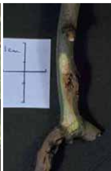
10.6 Cancros bacterianos jóvenes ( Pseudomonas savastano ) que carecen de la apariencia corchosa de las lesiones más viejas. Fraxinus excelsior , Yorkshire, Reino Unido