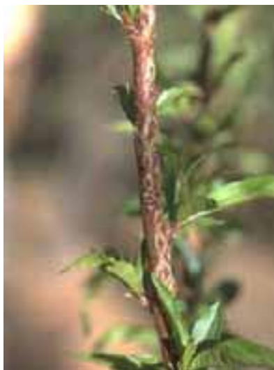
15.1 Daño por granizo. Las cicatrices han sanado encima del daño original. Prunus persica , Nor Cinti, Bolivia.

Los casos de crecimiento (15.2) o daño (15.3) inusuales se resuelven mejor buscando primero evidencia de necrosis y luego haciendo preguntas acerca de posibles fuentes de daño mecánico.