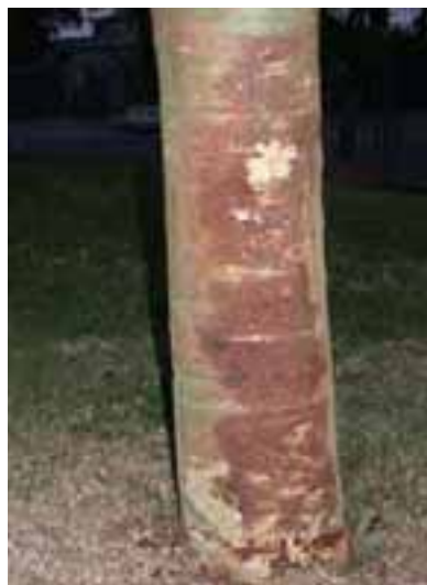
15.3 Daño causado por equipo de cortar césped. Acacia xanthophloea , Pretoria, Sudáfrica.