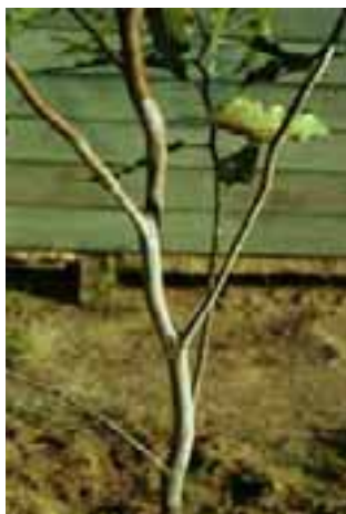
14.4 [izq.] Vaina micelial blanca de Erythricium salmonicolor . Eucalyptus sp., Brasil.