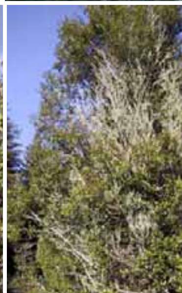
8.7 Muerte descendente debida posiblemente a enfermedad causada por Ganoderma en la raíz. Nothofagus sp., Rotorua, Nueva Zelanda.