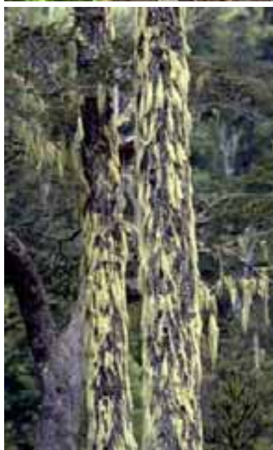
16.4 Crecimiento de líquenes. Araucaria araucana , Dead China, Chile.