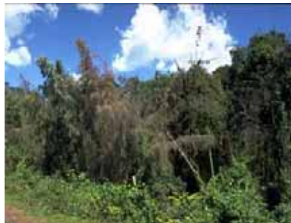
7.2 En primer plano, bambú moribundo que parece tener tizón pero es debido a su floración. Arundinaria alpina , Etiopía.