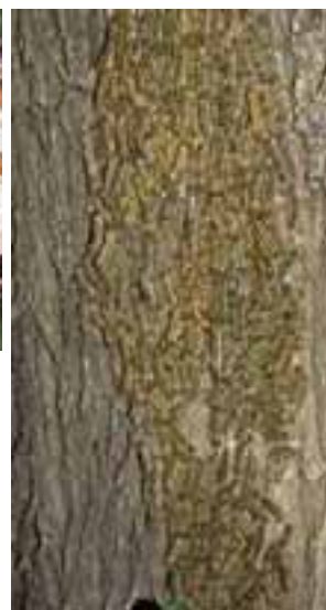
14.16 [der.] Agregación de larvas conocida localmente como sika sika (? Tolyte sp.). Schinus molle , Cochabamba, Bolivia.