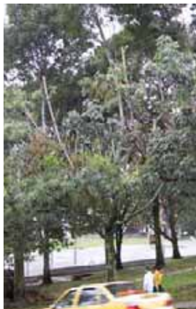
15.13 Poda para evitar interferencia con los cables eléctricos, realizada en forma inapropiada. Fraxinus udhei , Pereira, Colombia.