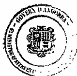
Juli Minoves Triquell Ministre des Affaires étrangères, de la Culture et de la Coopération

Veuillez agréer, Monsieur le Directeur général, les assurances de ma haute considération.