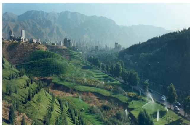
Tehran Parks and Green Space Organization