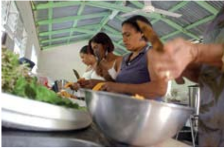
أحد مشروعات برنامج تليفود بسانديا، تجميز المحصول للتسويق في الجمهورية الدومينيكية

تستهدف مشروعات تليفود السكان الأشد فقراً من بين الفقراء وذلك من أجل تحسين وسائلهم الانتاجية، وتمكينهم من انتاج مزيد من الغذاء، وتوليد دخل نقدي لهم وتحسين وصولهم الى الغذاء.