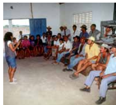
Una trabajadora de extensión se dirige a un grupo de agricultores en Brasil.