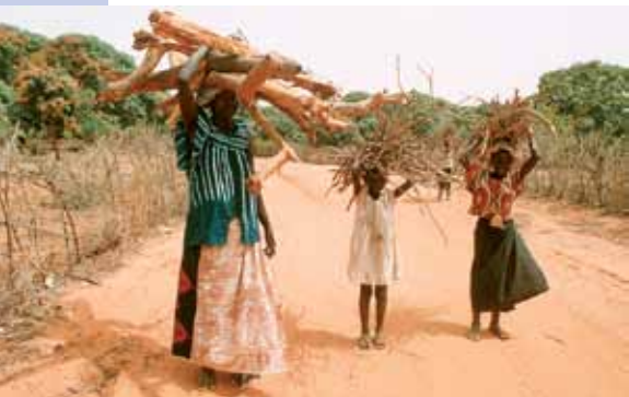
Madre e hijas recolectando leña en Senegal.