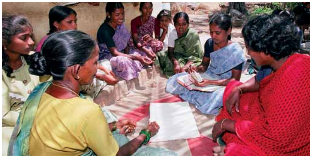
Cooperativa agrícola en India.

de exportación de productos agrícolas no tradicionales, que son mejor remunerados que los empleos agrícolas tradicionales.