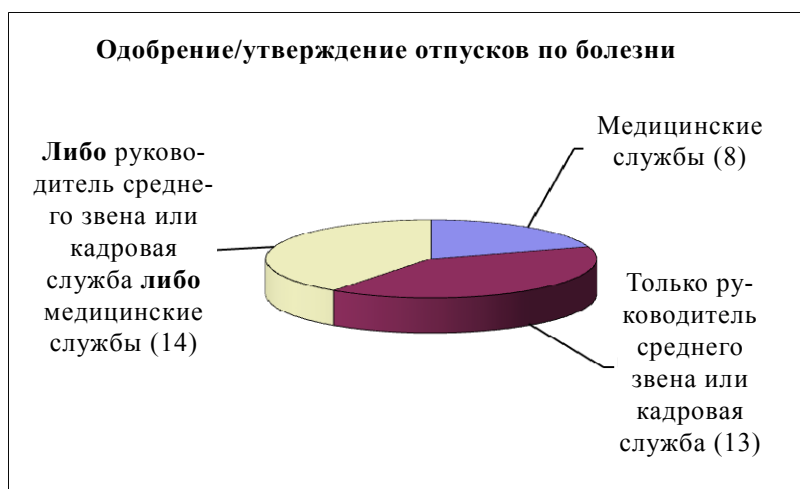
Диаграмма 2 Процесс одобрения/утверждения отпусков по болезни в организациях или органах

Руководитель среднего звена или департамент по вопросам людских ресурсов: (12/35) – ОДВЗЯИ, ЕК, ФАО, ИКАО, МФСР, МОТ, МСЭ, ОЭСР, БАПОР, ЮНВТО, ВПС, ВПП. Медицинские службы: (8/35) – ИМО, ОЗХО, ПАОЗ, ЮНЭЙДС, ЮНЕСКО, УВКБ, ЮНИДО, ВОЗ.