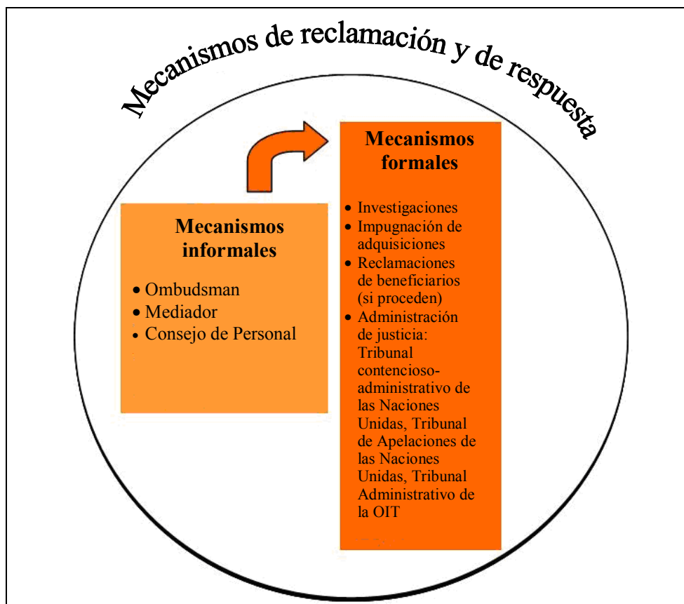
Mecanismos de reclamación y de respuesta

127. Un aspecto fundamental de la rendición de cuentas consiste en permitir al personal y a las partes interesadas solicitar y recibir respuestas a las reclamaciones y al daño alegado. Ese es el mecanismo por el que las partes interesadas pueden pedir cuentas a una organización cuestionando una decisión, actuación o política y obteniendo una respuesta adecuada a su queja. Para reducir al mínimo la necesidad de mecanismos de reclamación es necesario promover la transparencia, los controles internos y los procesos de evaluación. Los mecanismos de reclamación y de respuesta deben considerarse como último recurso para que las partes interesadas puedan exigir responsabilidades a la organización y para que las organizaciones tomen conciencia de las cuestiones a las que hay que dar respuesta. Constituye la parte reactiva de un marco de rendición de cuentas.