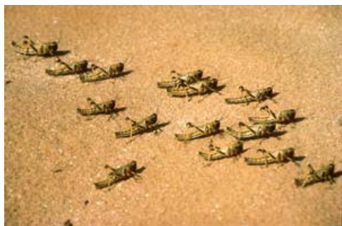
De jeunes larves de criquets pèlerins.

Une vigilance particulière s'impose aussi dans le nord-ouest de l'Afrique