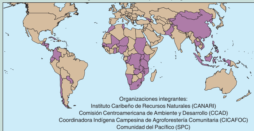
Integrantes del Mecanismo para los programas forestales nacionales