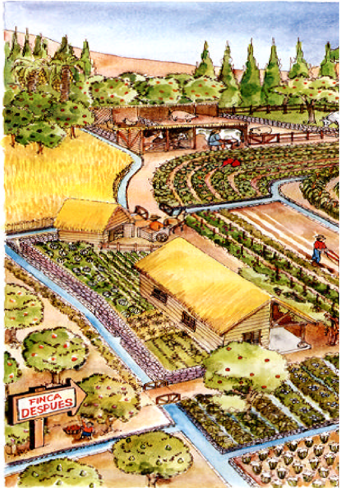
Dibujo Nº 6