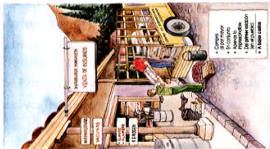
Dibujo Nº 8