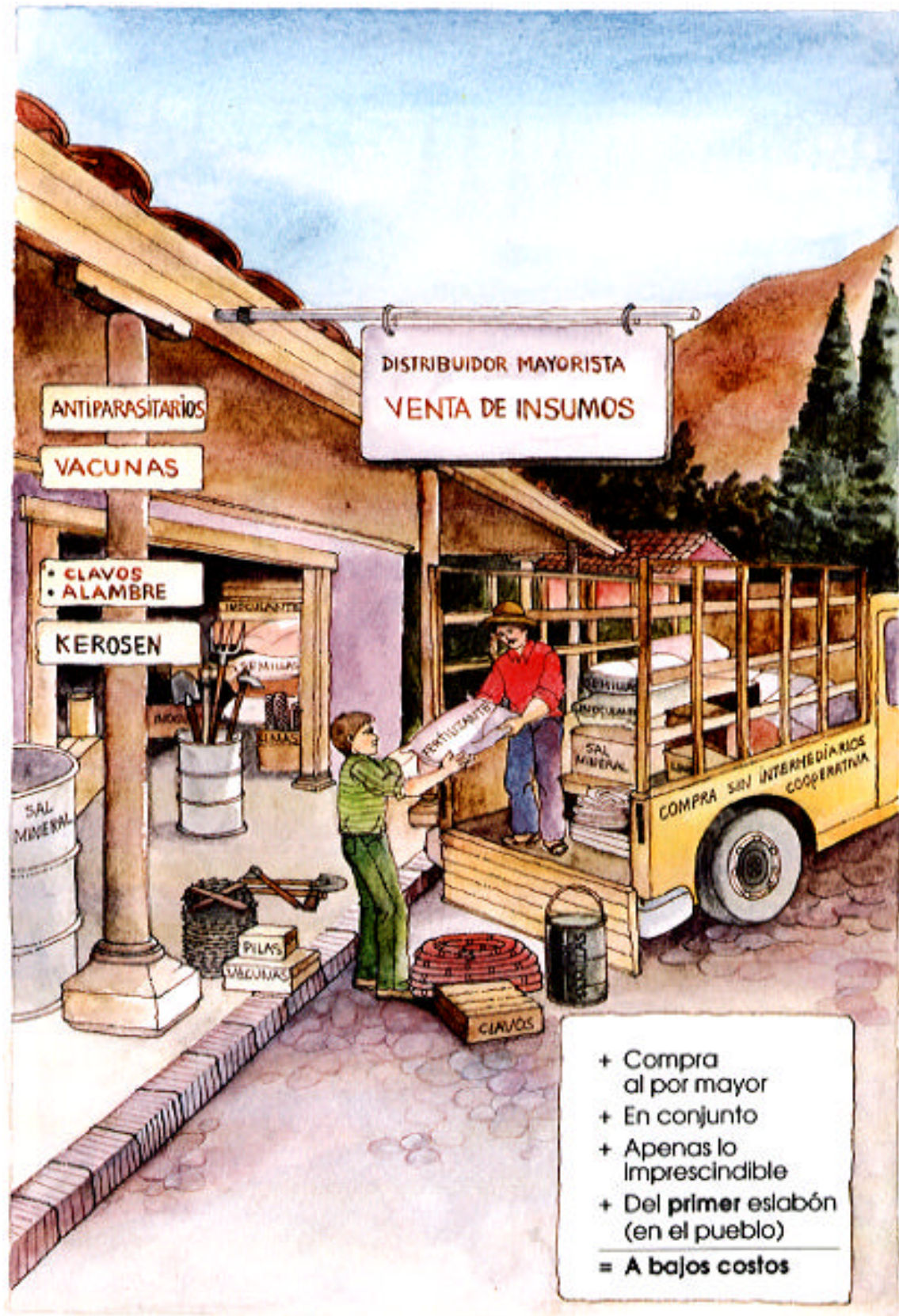
Dibujo Nº 5