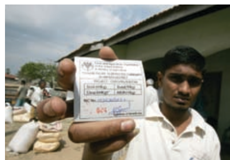
斯里兰卡海啸受灾农民出示领取粮农组织种子和肥料的证明。

渡的体制能力，其紧急干预措施旨在帮助所有社区提高他们的技能，将他们的农场建设得更好。