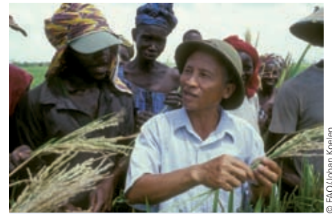
越南专家在南南合作计划的安排下赴塞内加尔工作，传授改良水稻的种植技术。

目前，加勒比共同体、太平洋岛屿论坛、西非货币联盟和经济合作组织正在主持实施区域计划。