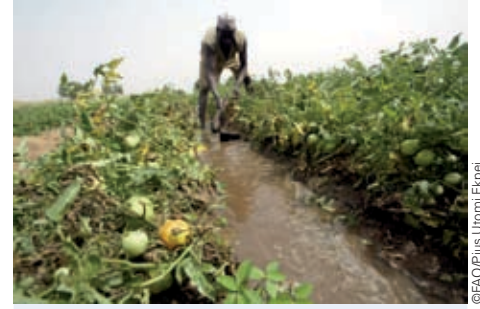
在国家粮食安全计划支持下，尼日利亚农民努力改进其灌溉系统。