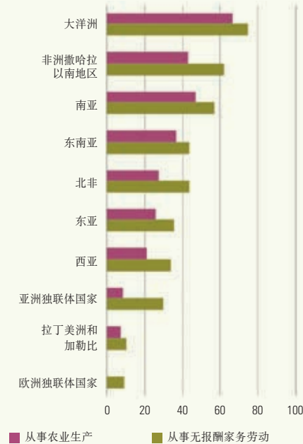
2007年从事农业生产的妇女比例和从事无报酬家务劳动的妇女比例

涵盖2008-2013年的粮农组织第四个“性别与发展行动计划”概述了本组织在粮食和营养、自然资源、农村经济、劳动力和生计，以及农业和农村发展政策规划领域的性别战略。该计划还考虑到许多方面所涉及的性别问题，这些方面包括目前全球关注的问题以及诸如农业生物多样性、紧急行动和恢复、粮食价格波动、气候变化和生物能源、疾病（人类、动物和植物）和全球化（贸易和不断变化的机构）等其他与粮食安全相关的主要问题。