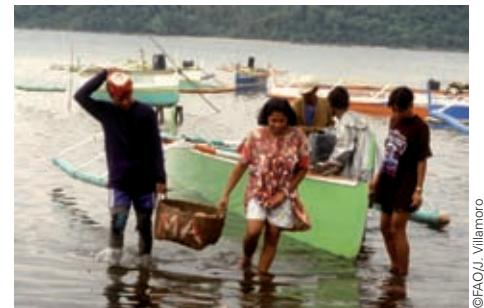
男女应当分担劳动。

认识男人和妇女的不同作用、需求和优先重点对于提高农业发展战略的效力至关重要。这种认识非常有助于了解他们所面临的不平等现象并确保这些情况反映在农业和农村统计中。