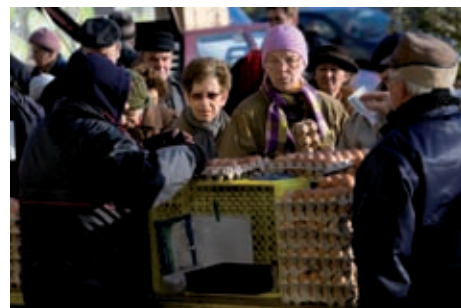
粮价上涨令所有人担忧。

在本世纪上半叶，全球对粮食、饲料和纤维的需求将增加近一倍，而作物则可能被越来越多地用于生物能源和其他工业目的。对新的和传统农产品的需求将给已经十分稀缺的农业资源造成不断加大的压力。虽然农业将被迫与日益扩张的城市住区争夺土地和水资源，它也需要适应并促进减缓气候变化和保护自然栖息地。农村社区将需要新的技术，在更少的土地上，使用更少的劳力来种植更多的粮食。