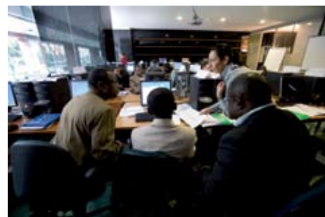
Addestramento sul modo migliore di usare i dati FAO.

strumento per la promozione di partnership con altre reti di informazione agricola; il secondo, assistere i paesi membri della FAO nella costruzione di una propria capacità manageriale per l'uso dell'informazione alimentare e agricola.