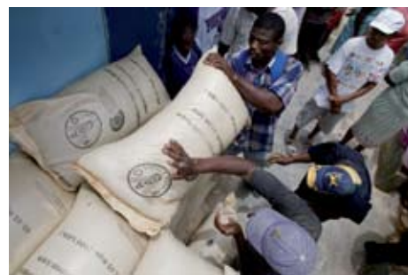
Distribuzione di sementi per un'emergenza in Haiti.