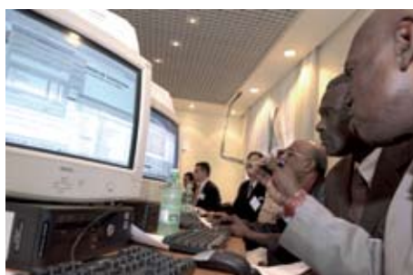
Personale statistico apprende l'uso di un database della FAO in un seminario di formazione.

L'insegnamento a distanza tramite computer sta rimpiazzando i vecchi metodi faccia a faccia come corsi, seminari e insegnamento pratico. Sul portale della FAO per lo sviluppo delle capacità sono disponibili materiali appositamente preparati per l'insegnamento ( www.fao.org/capacitybuilding ). Programmi di borse di studio sono gestiti con la collaborazione di governi e istituzioni, e agevolati dalla FAO. Un programma di borse di studio preparato insieme al Ministero ungherese dell'agricoltura, ad esempio, beneficerà 100 studenti di vari paesi per un periodo di cinque anni, con un dottorato finale in varie discipline agricole.