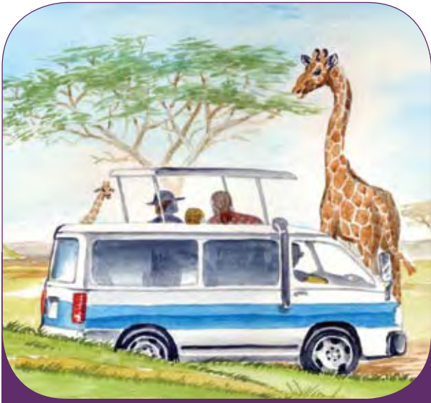
Wanyamapori wanavutia utalii

waraka utakaokuwa ukitolewa mara kwa mara! Waraka wa hivi karibuni unaeleza kuwa mapato yatokanayo na shughuli za uhifadhi yaende moja kwa moja kwa Serikali, ambayo itarudisha asilimia fulani vijijini.