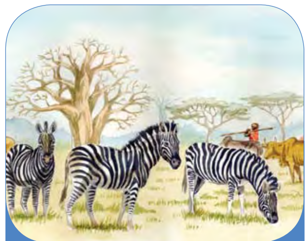
Matumizi ya pamoja ya rasilimali kati ya mifugo na wanyamapori

Ugonjwa ni zaidi ya suala la vimelea. Viwango vya ugonjwa vinaongezeka au kupungua kutegemeana na