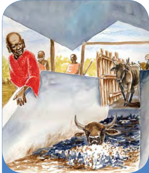
Kuogesha ng'ombe kwenye joshu

Ndigana inasambazwa na kupe wa kahawia washambuliao masikio, ambao hushambulia mbogo. Mbogo hupendelea sehemu zenye vichaka - sehemu ambazo kwa hali ya kawaida ng'ombe hupata malisho wakati wa kiangazi.