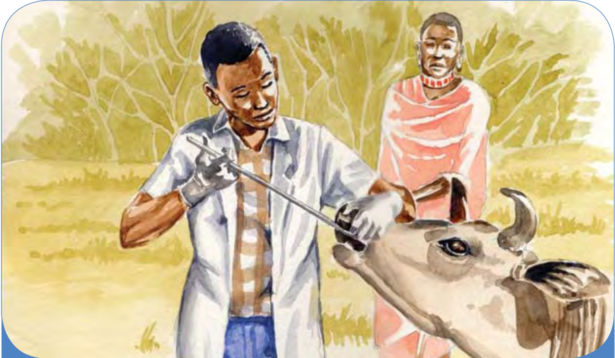
Daktari wa mifugo akimtibu mfugo