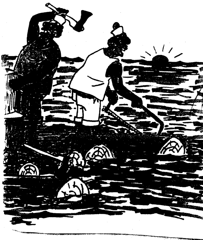
Pollution des ressources naturelles et antagonismes structurels