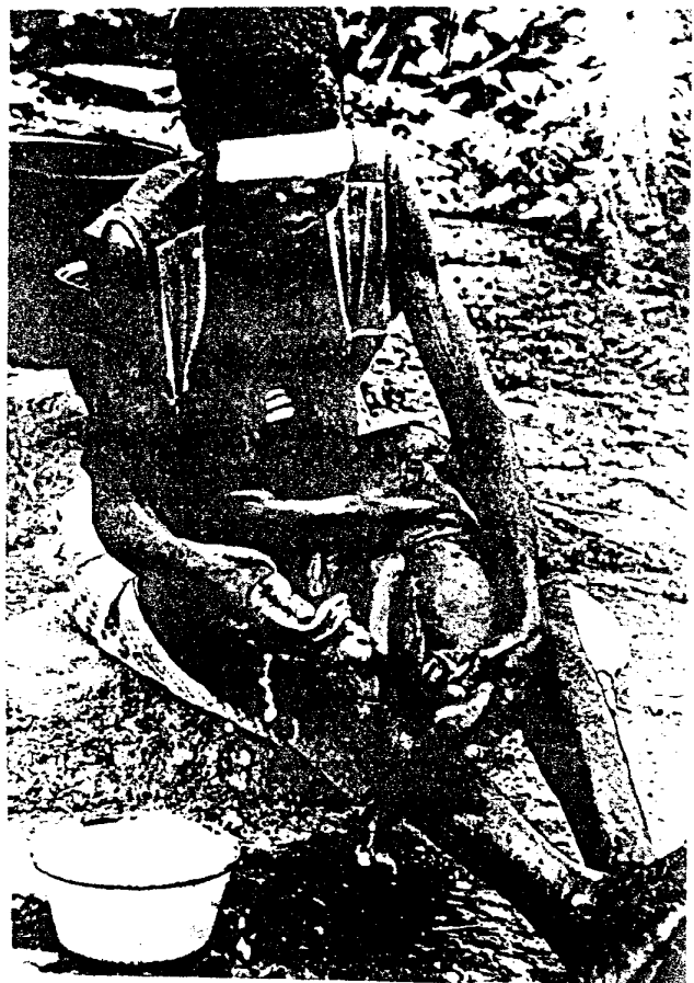
Femmes clés de la sécurité alimentaire !!!