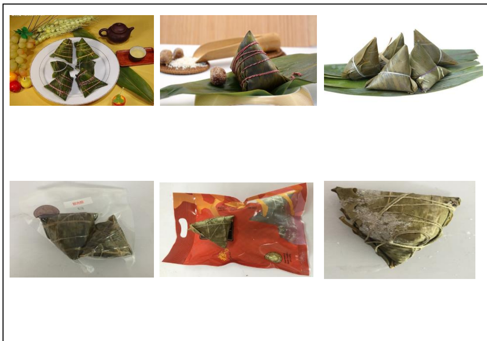
图 2 各式各样的中国粽子