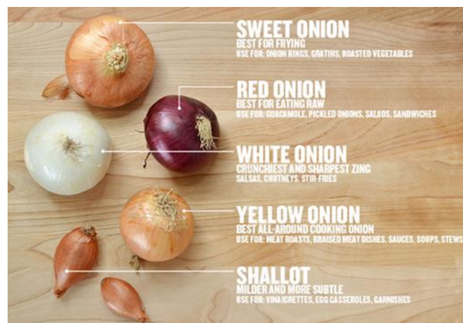
Figure 3. Types de Plantes d'Oignons

L'élaboration de la norme pourrait se faire en trois séances du CCFFV ou moins, en fonction de la participation des membres et des accords pris entre eux. les.