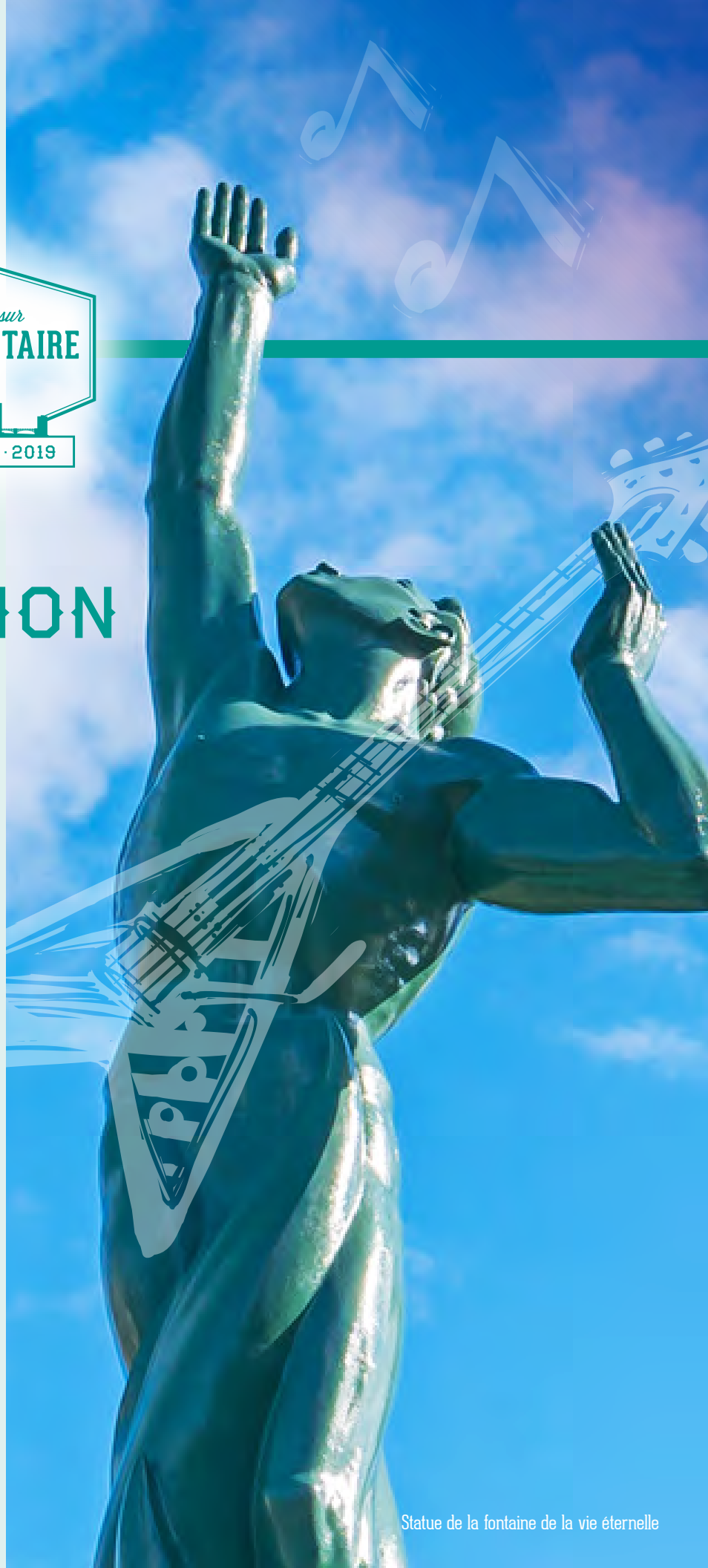
Statue de la fontaine de la vie éternelle

La séance plénière commencera le lundi 4 novembre à 9 h 30 et se terminera après l'adoption du rapport, le vendredi 8 novembre.