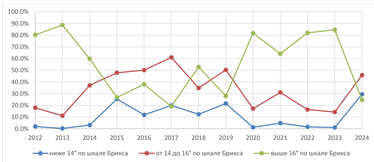
Рисунок 2. Доля образцов с содержанием растворимых твердых веществ ниже 14° по шкале Брикса, с содержанием от 14 до 16° по шкале Брикса и с содержанием выше 16° по шкале Брикса в винограде, выращенном в штате Риу-Гранди-ду-Сул, Бразилия, в период с 2012 по 2024 год

Ежегодно меняющиеся почвенно-климатические факторы существенно отражаются на содержании растворимых твердых веществ. По мнению Бразилии, наиболее важным представляется анализ процентного содержания таких веществ в продукте в следующих трех диапазонах: ниже 14° по шкале Брикса, от 14 до 16° по шкале Брикса и выше 16° по шкале Брикса. Принимая во внимание изменения этих параметров, которые отражены на графике ниже (рисунок 2) в виде трех линий, становится очевидно, что оценка средних значений по шкале Брикса должна выполняться с особым тщанием, поскольку для получения представления о содержании твердых растворимых веществ в произведенном винограде в целом необходимо учитывать вариативность их содержания во всех представленных образцах.