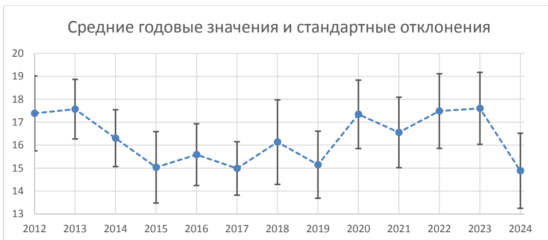
Рисунок 1. Среднегодовое и стандартное отклонение содержания растворимых твердых веществ в винограде, выращенном в штате Риу-Гранди-ду-Сул, Бразилия, в период с 2012 по 2024 год (в градусах по шкале Брикса)

Ежегодно меняющиеся почвенно-климатические факторы существенно отражаются на содержании растворимых твердых веществ. По мнению Бразилии, наиболее важным представляется анализ процентного содержания таких веществ в продукте в следующих трех диапазонах: ниже 14° по шкале Брикса, от 14 до 16° по шкале Брикса и выше 16° по шкале Брикса. Принимая во внимание изменения этих параметров, которые отражены на графике ниже (рисунок 2) в виде трех линий, становится очевидно, что оценка средних значений по шкале Брикса должна выполняться с особым тщанием, поскольку для получения представления о содержании твердых растворимых веществ в произведенном винограде в целом необходимо учитывать вариативность их содержания во всех представленных образцах.