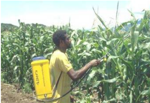
Aplicando plaguicidas sin vestimenta de protección

Estas recomendaciones pueden orientar la redacción de borradores de regulaciones, la preparación de programas de extensión, y la revisión y aprobación de instrucciones en la etiqueta.