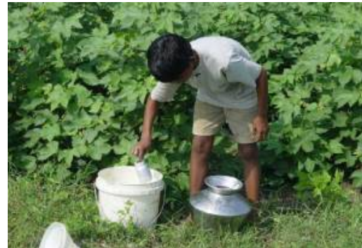
Un joven manipula peligrosamente los plaguicidas para su aplicación