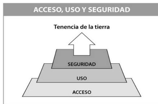
Figura 1. Acceso, uso y seguridad en la tenencia de la tierra 17

A lo largo de este documento, el alcance del acceso efectivo a la tierra se trata desde diferentes perspectivas. La primera es una visión global de acuerdo a la cual el acceso a la tierra se entiende como un asunto de interés público en el que una multiplicidad de sectores a nivel nacional, regional y local deben ser tomados en consideración. Los planes de desarrollo y ordenamiento territorial exigen una concertación entre distintos actores a escala nacional y descentralizada. Las políticas de infraestructura y el manejo de suelos y fuentes hídricas no pueden ser definidos sin pensar en los impactos que su desarrollo genera en el acceso a los alimentos. Por ejemplo, un inadecuado uso de técnicas para incrementar la producción agrícola en un determinado municipio, puede fácilmente desencadenar la contaminación de un río y su impacto afectará no sólo el municipio sino el departamento o la región entera. La interacción entre ciudades y zona rural es también un aspecto de gran importancia para obtener resultados sostenibles en términos de tenencia, planeación y uso de la tierra.