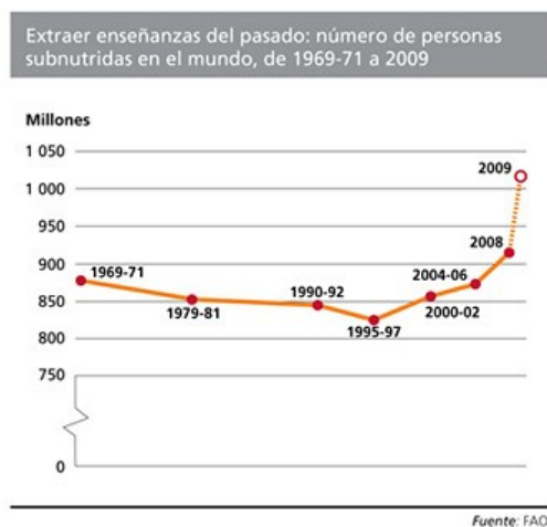
Gráfico 2. Número de personas subnutridas en el mundo (Millones)