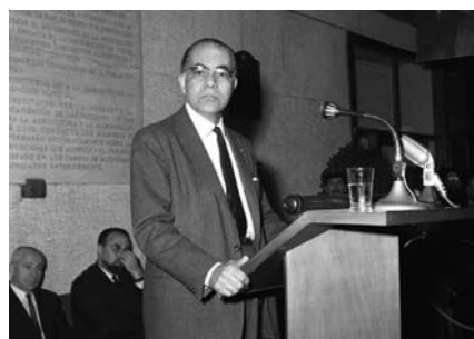
曾在1951年至1955期间担任粮农组织理事会主席的Josué de Castro博士（巴西）1963年11月在罗马粮农组织大会第十二届会议上发表讲话。

“饥饿就是排斥”，著名的巴西医生和反饥饿倡导者Josué de Castro（1908–1973年）写到。