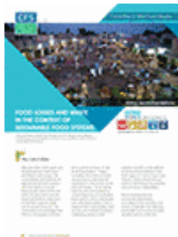
Pertes et gaspillages de nourriture dans le contexte de systèmes alimentaires durables (2014)