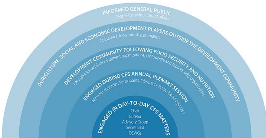
Tableau 1: Publics ciblés par le CSA