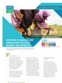
Investir dans la petite agriculture en faveur de la sécurité alimentaire et de la nutrition (2013)