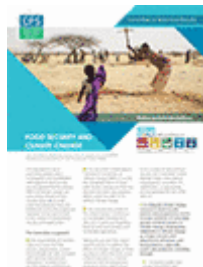
Sécurité alimentaire et changement climatique (2012)