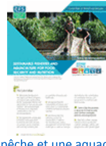
Une pêche et une aquaculture durables au service de la sécurité alimentaire et de la nutrition (2014)