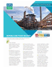
Agrocarburants et sécurité alimentaire (2013)