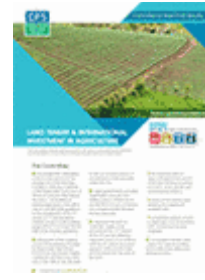
Régimes fonciers et investissements internationaux en agriculture (2011)