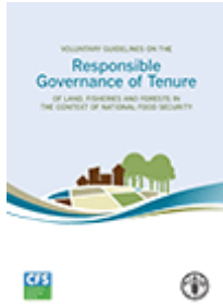
Directives volontaires pour une gouvernance responsable des régimes fonciers applicables aux terres, aux pêches et aux forêts dans le contexte de la sécurité alimentaire nationale (VGGT) (2012)