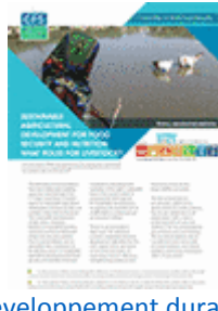
Le développement durable au service de la sécurité alimentaire et de la nutrition: quels rôles pour l'élevage ? (2016)