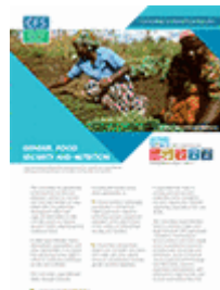
Parité hommes-femmes, sécurité alimentaire et nutrition (2011)