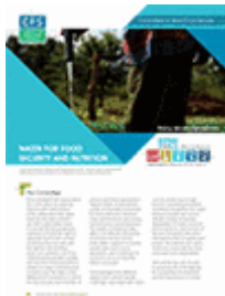
L'eau, enjeu pour la sécurité alimentaire mondiale (2015)