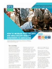
Comment accroître la sécurité alimentaire et les investissements favorables aux petits exploitants agricoles (2011)