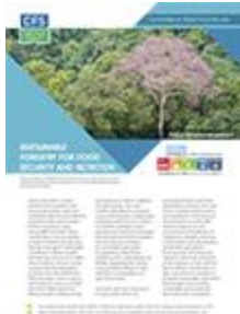
Gestion durable des forêts au service de la sécurité alimentaire et de la nutrition (2017)