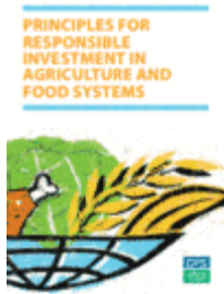
Principes pour un investissement responsable dans l'agriculture et les systèmes alimentaires (CFS-RAI) (2014)