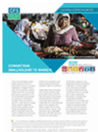
Établir un lien entre les petits exploitants et les marchés (2016)