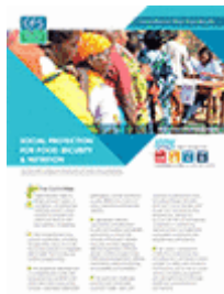
La protection sociale pour la sécurité alimentaire et la nutrition (2012)