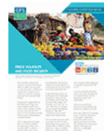
Instabilité des prix et sécurité alimentaire (2011)