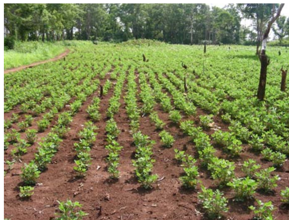
Parcelle d'arachide à Dissikou (Nana Grebizi) en mi-Juin 2008

Les quantités de semences mises en multiplications sont de 10 t pour l'arachide, 1 t pour le sorgho et 6 t pour le niébé.