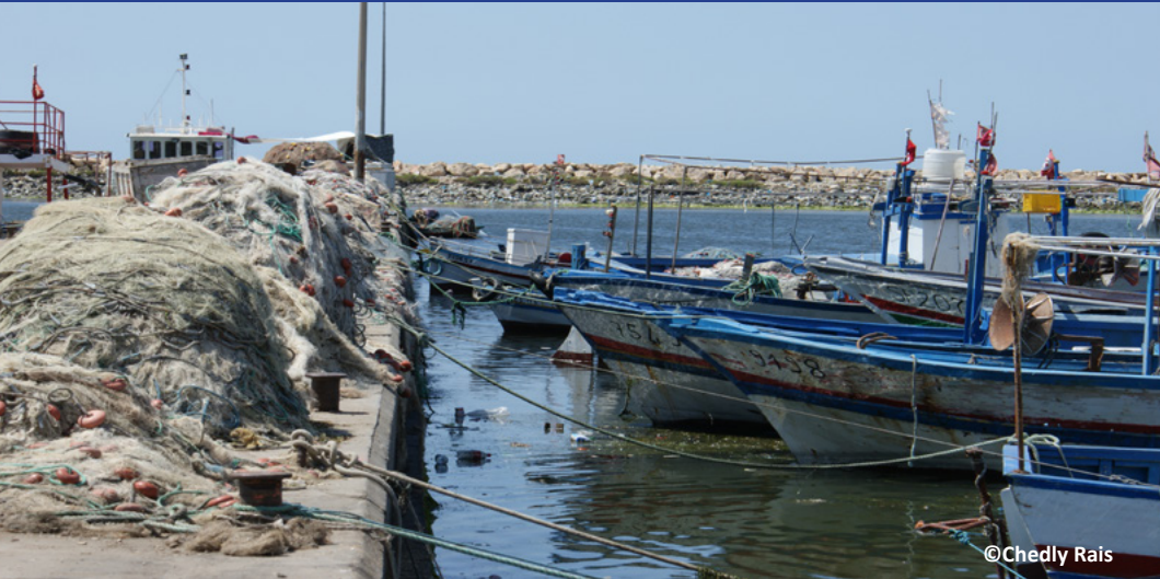
The ACCOBAMS (Agreement on the Conservation of Cetaceans of the Black Sea, Mediterranean Sea and Contiguous Atlantic Area) and GFCM (General Fisheries Commission for the Mediterranean) Secretariats are coordinating, in collaboration with RAC/SPA (Regional Activity Centre for Specially Protected Areas), a project which aims to enhance the conservation of endangered marine species, such as cetaceans, sea turtles and seabirds, and to promote responsible fishing practices in the Mediterranean.

Six actions pilotes reposant sur une démarche participative engagée par les partenaires nationaux avec les pêcheurs, seront mises en œuvre en France, en Espagne, au Maroc et en Tunisie. Après une phase durant laquelle les données seront collectées et les problèmes cernés, des mesures d’atténuation seront mises en œuvre en vue de limiter les captures accidentelles d’espèces menacées ainsi que la déprédation dans un certain nombre de pêcheries. Une étude préliminaire portant sur les interactions entre les espèces marines menacées et les activités de pêche est également en cours en Algérie. Ce projet d’une durée de 2 ans (2015-2016) bénéficie d’un important soutien financier de la Fondation MAVA.