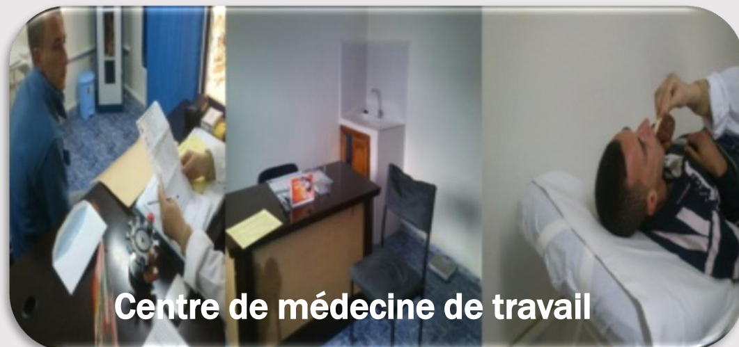
Centre de médecine de travail

Plusieurs structures d'accompagnement ont été réalisées au niveau de ce port permettant ainsi l'amélioration des conditions socioéconomiques des professionnels, à savoir