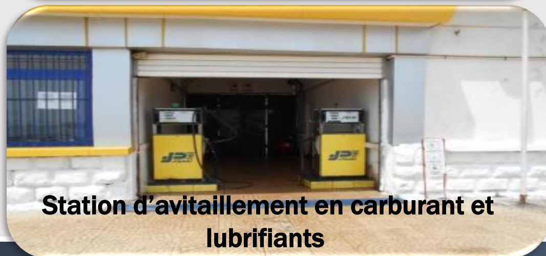
Station d'avitaillement en carburant et lubrifiants