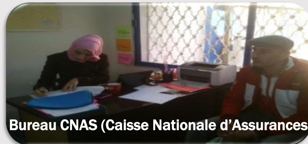
Bureau CNAS (Caisse Nationale d'Assurances)