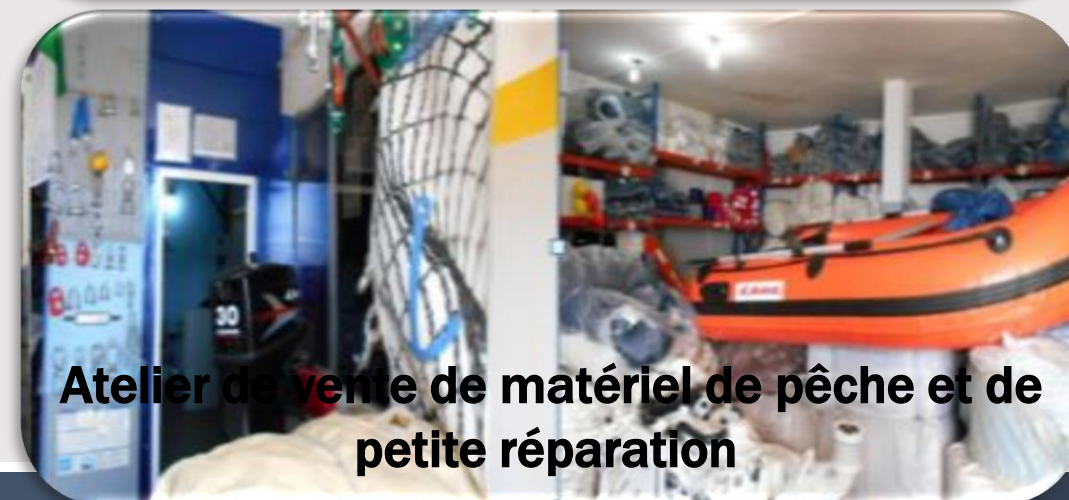
Atelier de vente de matériel de pêche et de petite réparation