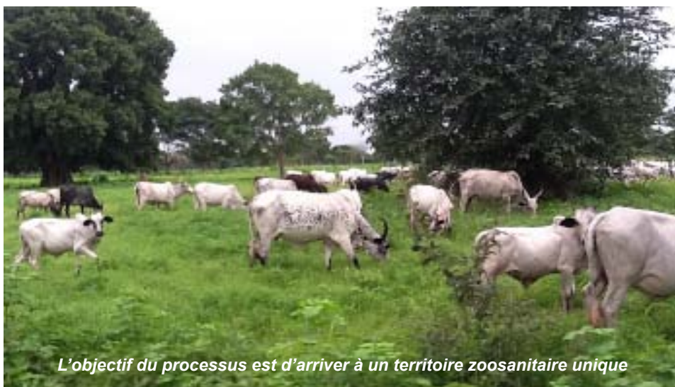
L'objectif du processus est d'arriver à un territoire zoosanitaire unique

A l'issue des différentes rencontres à N'Djamena avec des groupes de discussion, il a été admis par tous que la création d'un marché commun des produits d'origine animale constituera une source importante de croissance de la zone CEMAC. Ce marché va permettre l'exploitation des avantages comparatifs de la zone, réduire d'avantage la dépendance de la zone sur le marché extérieur et contribuer significativement à la lutte contre la pauvreté et l'insécurité alimentaire. Le processus de création de ce marché concernera l'élimination des droits de douane intérieurs, des restrictions quantitatives à l'entrée et à la sortie des marchandises, des taxes et toute autre mesure d'effet équivalent susceptible d'affecter les transactions entre les Etats de la