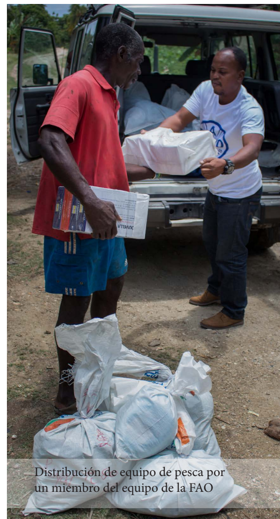
Distribución de equipo de pesca por un miembro del equipo de la FAO

Como parte de este plan de respuesta humanitaria para el año 2022, se ha recibido financiamiento para actividades adicionales que deberán implementarse en las próximas semanas y meses. Esto afecta en particular a 1.500 hogares dedicados a la producción de alimentos, 4.000 hogares dedicados a la horticultura y 3.500 hogares dedicados a la cría de cabras y aves de corral.