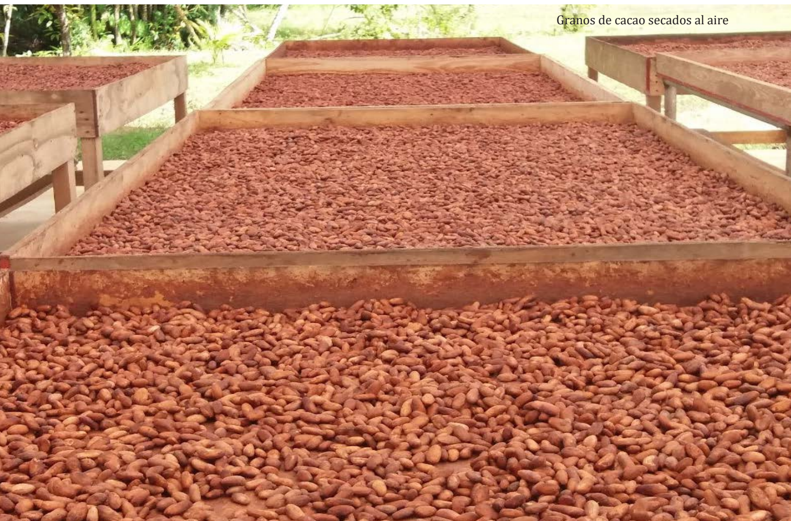
Granos de cacao secados al aire

afectará a 22.458 familias, de las cuales el 30 por ciento son jefes de hogar. Se fomentará la producción de cacao y café dado el potencial financiero que representan estos cultivos y su capacidad para desarrollarse en simbiosis con las especies objetivo del proyecto. Lanzado oficialmente el 16 de noviembre de 2022 en presencia de las autoridades de los Ministerios de Medio Ambiente y Agricultura y los Representantes del PNUD y la FAO, el proyecto se extenderá por un período de siete años.