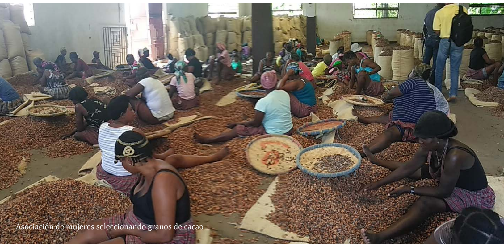
Asociación de mujeres seleccionando granos de cacao

El enfoque concertado de tres agencias de la ONU para la implementación de un proyecto común es una aplicación práctica del enfoque «Una ONU», cuyo objetivo es generar resultados de desarrollo sostenibles y concretos, identificando sinergias y confiando en la experiencia de cada una de las organizaciones en el interés de todos.