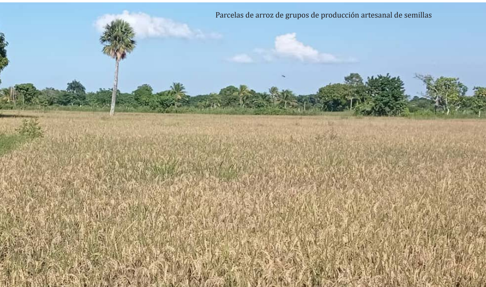
Parcelas de arroz de grupos de producción artesanal de semillas

Este proyecto se implementa en estrecha colaboración con el MARDNR, la CNSA, la Dirección Departamental de Agricultura del Nordeste (DDA-NE), las Oficinas Agrícolas de los Municipios de intervención. Está alineado con la Política Nacional de Semillas y el PSNSSANH.