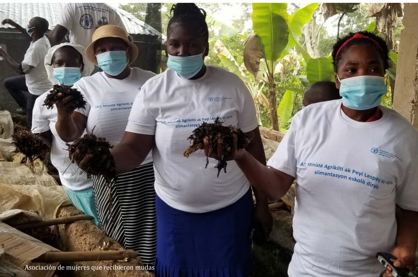
Asociación de mujeres que recibieron mudas

El proyecto «Fortalecimiento del empoderamiento y liderazgo socioeconómico de las mujeres que viven en zonas rurales» será implementado por la FAO, en estrecha colaboración con el MCFDF, el MARNDR a través de las Direcciones Departamentales del Sur y Sureste y las oficinas agrícolas de las comunas objetivo. Este proyecto reafirma el compromiso de la FAO de apoyar los esfuerzos gubernamentales para el empoderamiento socioeconómico de las mujeres rurales.