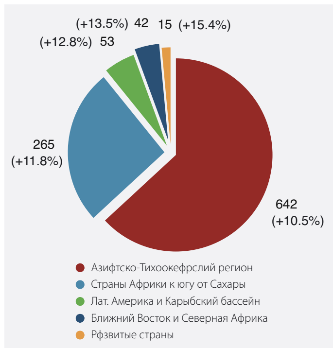
Диаграмма 3: Оценочная численность голодающих в 2009г. в разбивке по регионам (млн. чел.) и увеличение к уровню 2008г. (%)