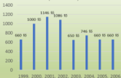
Falugazdász létszámok (1999-2006.)

A 2005. évi gazdatüntetések során a termelők kérésére a mindenkorai agrárminiszter garantálta, hogy szinten tartja a falugazdászok létszámát.