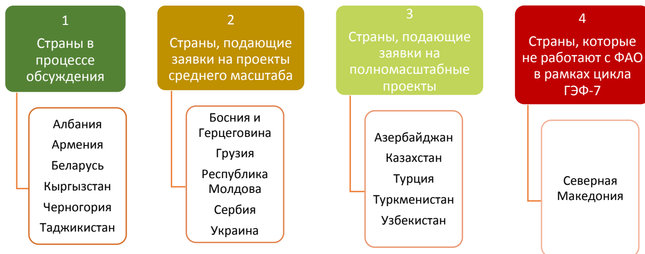
Рисунок 4: Страны по категориям