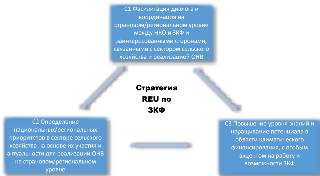
Рисунок 1: Компоненты стратегии REU по расширенному взаимодействию с ЗКФ

Региональная стратегия включает три компонента, которые напрямую связаны друг с другом, как показано на Рисунке 1.