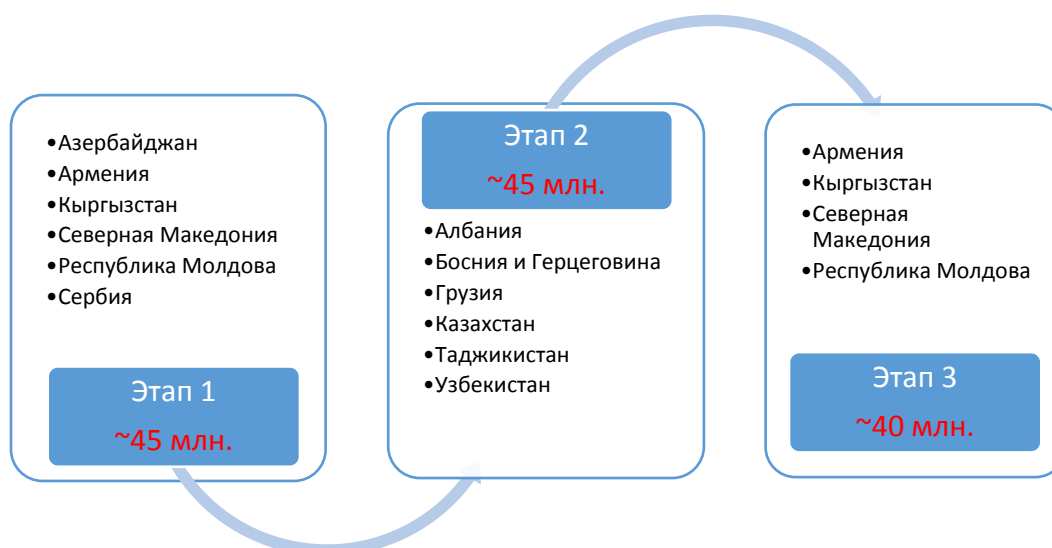
Рисунок 2: Целевые страны для реализации стратегии

Стратегия будет реализована в три этапа, охватывающих краткосрочную и среднесрочную перспективу, в течение четырехлетнего периода. Стратегия будет пересматриваться и корректироваться по мере необходимости, чтобы обеспечить полное соответствие региональному/страновому контексту и потребностям, а также прогрессу, достигнутому в реализации Стратегии ФАО в отношении изменения климата, и лучше реагировать на наиболее актуальные проблемы, с которыми сталкивается регион.